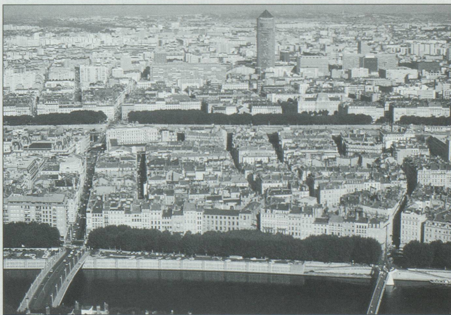
... « La Suisse était en 1994, le 6 e plus important marché étranger de la Région Rhône-Alpes et son 8 e fournisseur »...