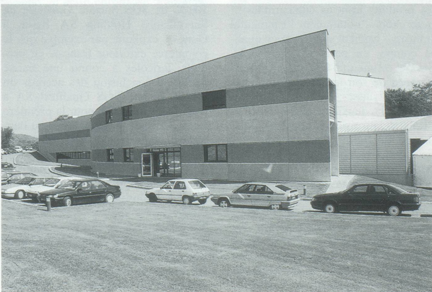
Photo : Siège de la Société Spécialités de Fontain Cornu SA, dans le Doubs.