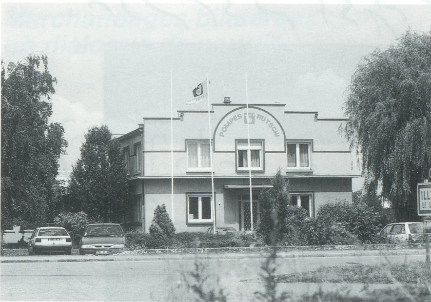
Photo : Siège des Pompes Rutschli en France, Illzach.

... « les entreprises... utilisent leurs installations bien plus longtemps et de façon bien plus intensive que par le passé... »