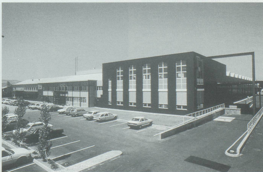
Photo : Les bâtiments de SFS Stadler SA à Valence.

L'envolée continue du franc suisse en 1995 a également donné des ailes au « petit trafic frontalier » entre la France et la Suisse. Compte tenu du panier moyen de la ménagère, le consommateur suisse réalise une économie d'environ 35 % en achetant en France. Les visiteurs vaudois ou genevois iraient ainsi dépenser chaque année entre 400 et 600 millions de francs suisses en France voisine. C'est pour répercuter une partie de cette « fuite de capitaux » que Migros, le géant helvétique du commerce de détail, a investi quelque 60 millions de francs suisses pour installer deux supermarchés juste au-delà de la frontière, à Thoiry et Étrembières. Mais si Migros France a enregistré une croissance à deux chiffres, les établissements Migros genevois ont vu leur chiffre d'affaires baisser de 3,6 % l'année dernière.