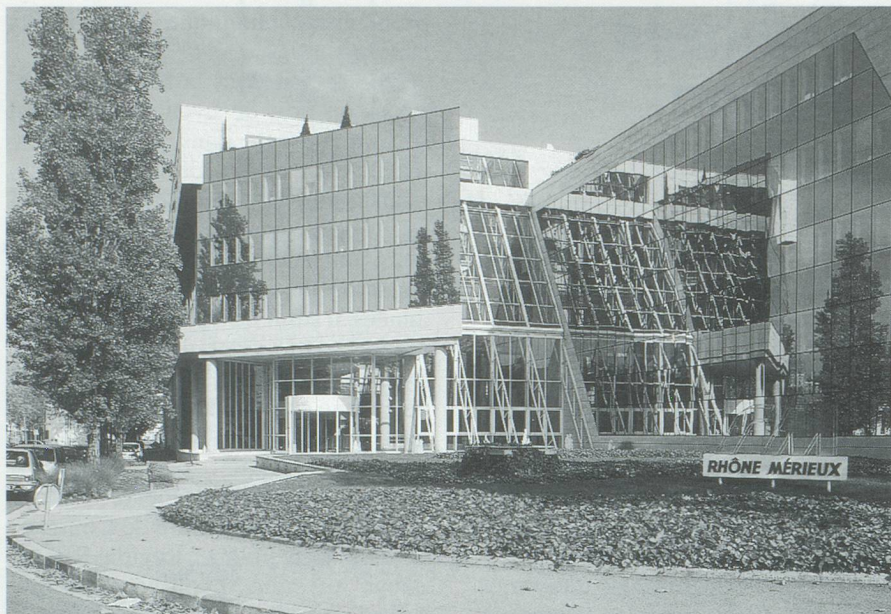
Photo : les laboratoires Rhône Mérieux construits par l'entreprise Sogelym.

concurrence. Cette modernisation forcée remplit également les livres de crédit de la filiale de la Banque Cantonale de Genève qui estime que des taux d'intérêts français plus bas permettraient à la banque d'accorder des prêts encore plus nombreux.