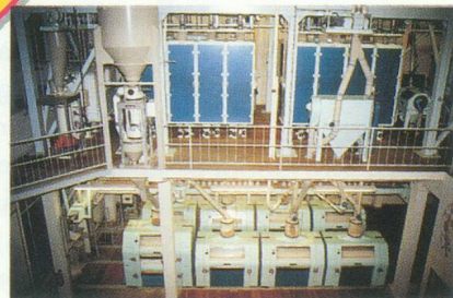
Moulin de Surgères, 200 t/24h