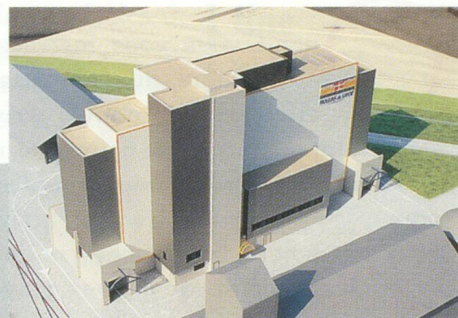
S.A. Chiron, Moulins de Savoie, Chambéry, 150 t/24h

Non!—chaque point représente un de nos plus importants clients en France. Meuniers, que nous avons été et serons heureux de servir.