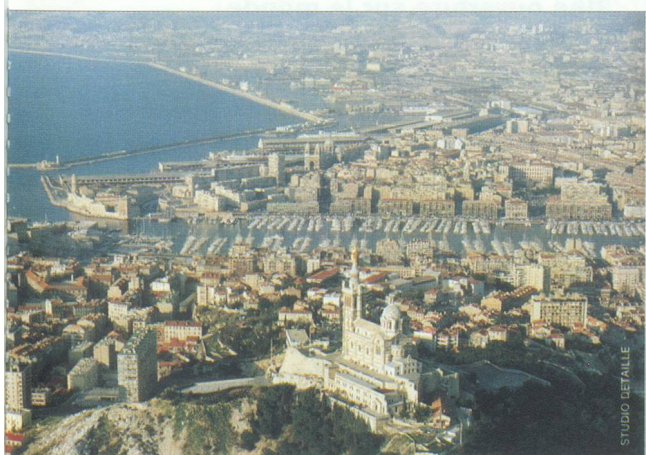
Marseille : la capitale des Bouches-du-Rhône mais aussi celle de la région PACA.

Le Bas-Rhône et les régions littorales, de Fos à la frontière italienne, concentrent 90 % des effectifs industriels. La région PACA arrive au 5 e rang des régions françaises en termes d'effectifs employés et de valeur de la production industrielle, après l'Ile-de- ▶▶▶