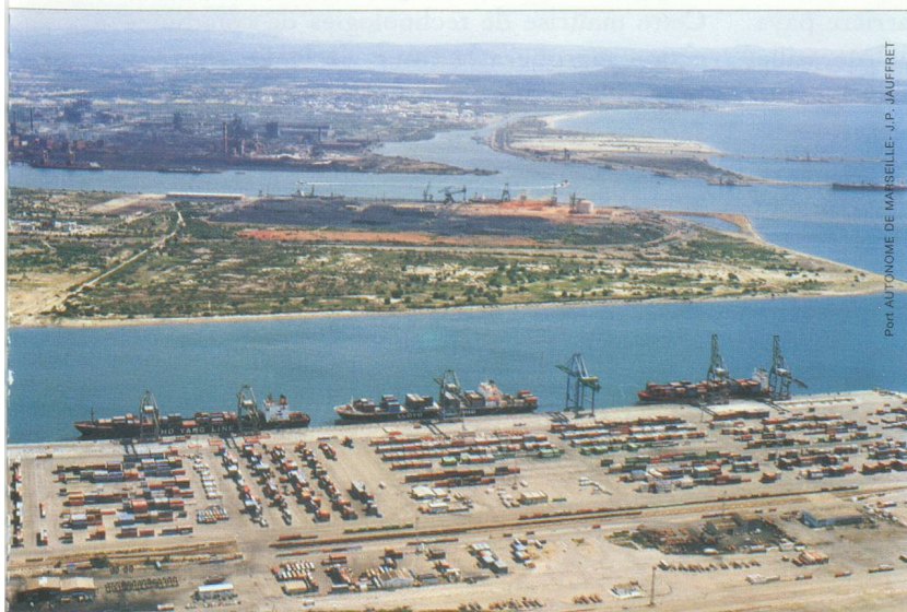
Port AUTONOME DE MARSEILLE - J.P. JAUFFRET

ou sociétés de distribution internationale.