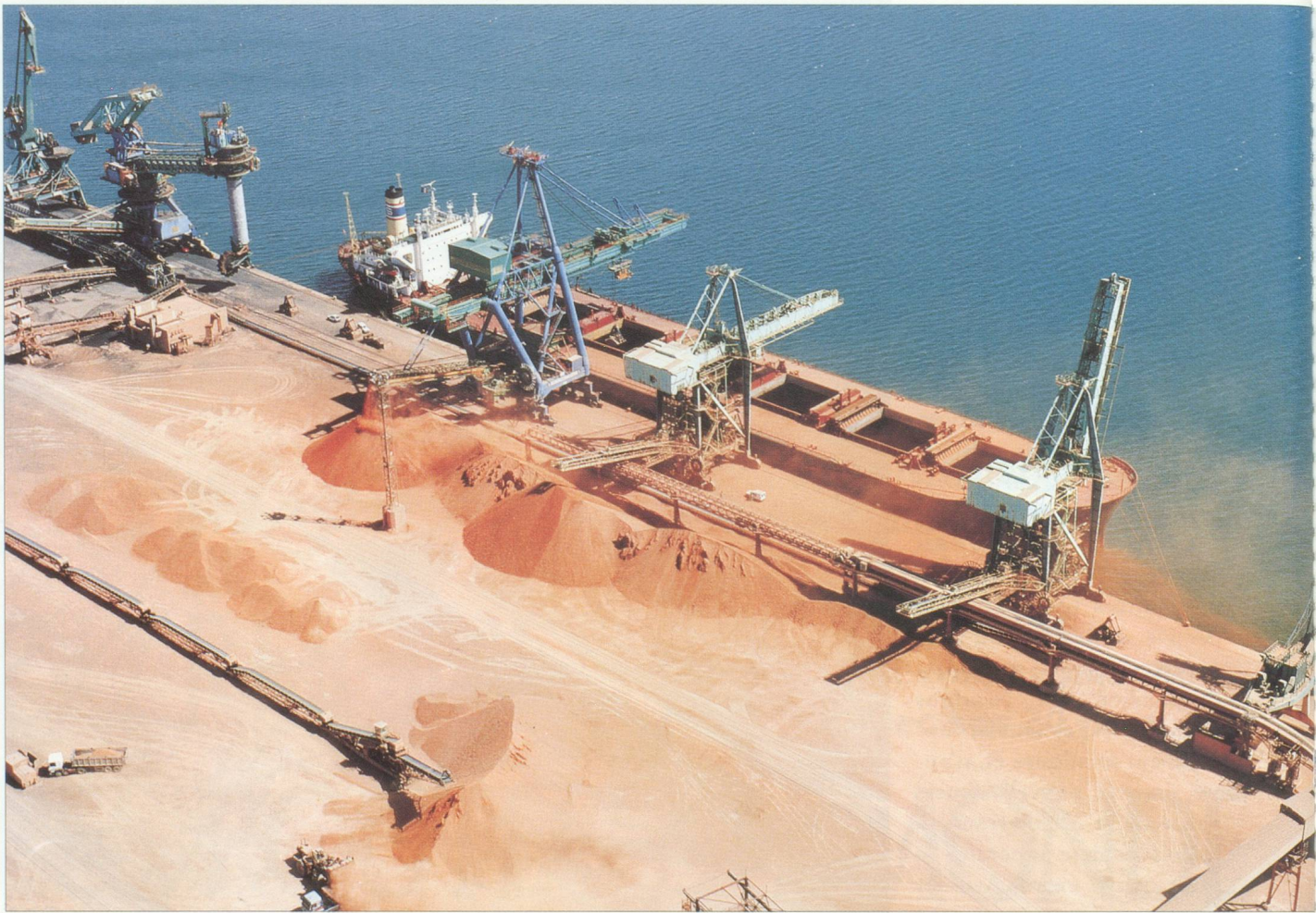
Terminal Minéralier de Fos

aux plus grands navires du monde : la position centrale sur l'arc méditerranéen au croisement des deux axes principaux de communication de l'Europe du Sud, tout particulièrement celui de la Vallée du Rhône et la Saône, pénétrante directe au cœur du continent, bientôt reliée au réseau rhénan.