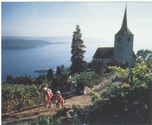
Parmi nos atouts : le caractère traditionnel de nos stations

En été, les habitants du Sud apprécient notre pays pour son calme et sa fraîcheur