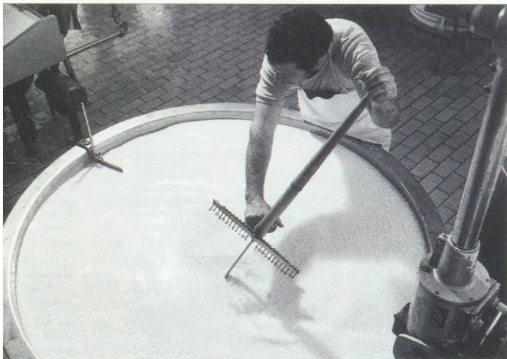
Fromagerie de Gruyère

Ce soixante quinzième anniversaire est l'occasion idéale pour découvrir quelques membres de la CCSF-Marseille Sud-Est Méditerranée