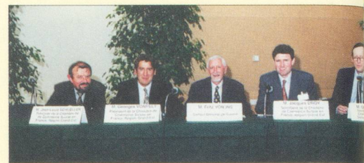
Manifestation publique de la Chambre de Commerce Suisse en France, Région Grand-Est, à Mulhouse le 23 mai 1996.

Nous vous remercions de bien vouloir nous faire connaître à vos amis et relations, à tous ceux qui ont un intérêt à notre démarche.