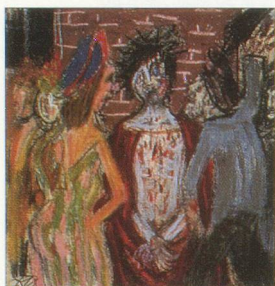
Otto Dix, "Dérision du Christ", (1948). Pastel sur papier. Städtische Galerie, Albstadt.

Le Retable d'Isenheim a été exécuté par Grünewald entre 1510 et 1516. Autour de la chair meurtrie du Christ et du désespoir de sa crucifixion, il représente pour la génération des peintres allemands du début du siècle le symbole de l'interrogation religieuse et du retour aux valeurs nationales.