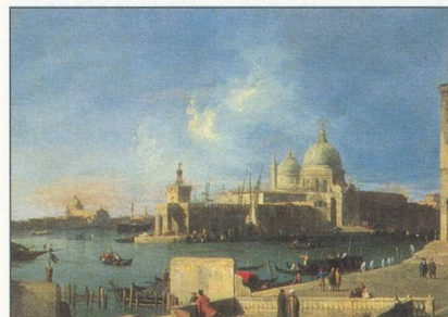
A. Canaletto (1697-1768), "Vue de la Salute depuis l'entrée du Grand Canal", Musée des Beaux-Arts, Strasbourg.

Journaliste, spécialiste des arts plastiques