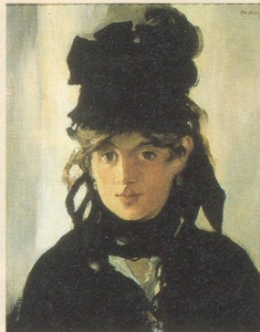
Edouard Manet : "Berthe Morisot au bouquet de violettes", 1872. (Collection particulière).

"Exposition Manet", Fondation Pierre Gianadda, 1920 Martigny. Tél. (26) 22.39.78. Jusqu'au 11 novembre 1996.