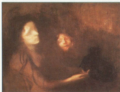
Eugène Carrière, "Le chapeau", Musée Marmottan, Paris.