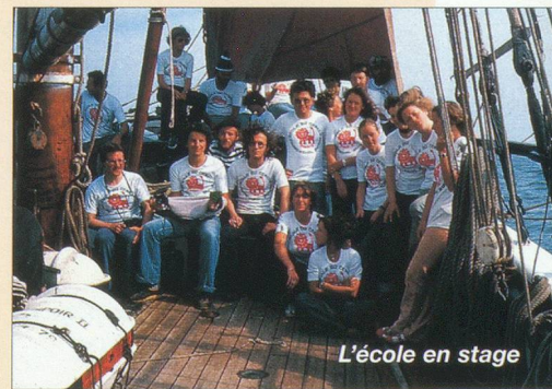
L'école en stage

culturel, car on ne peut parler et comprendre véritablement une langue sans connaître le contexte dans lequel celle-ci se développe. Par des programmes respectant les exigences de la vie pratique, par une pédagogie novatrice, par de très nombreuses visites - à caractère culturel ou professionnel - dans divers endroits de France, par l'immersion de ses élèves en milieu familial, par des possibilités de stage en entreprise, l'Ecole Suisse Internationale offre donc ce cocktail réussi d'un institut d'enseignement totalement ouvert au monde extérieur. Elle le prouve au fil des saisons par d'excellents résultats aux examens nationaux et internationaux (DEL/DALF, ou examens de la CCIP).