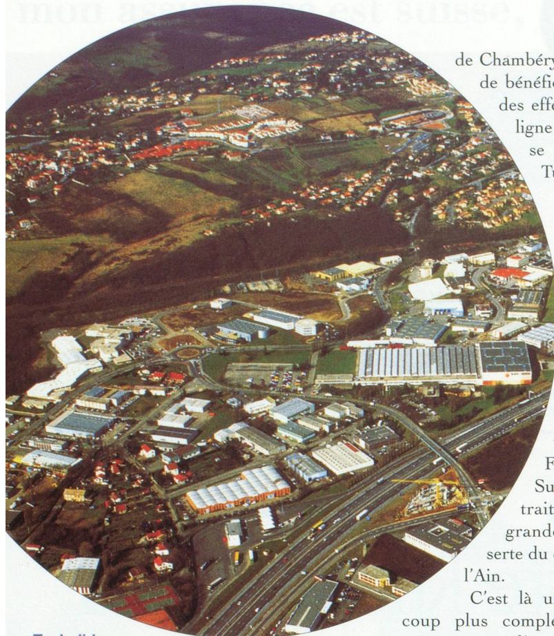
Techclid, pôles d'entreprises performantes au nord-ouest de Lyon

par la réalisation de plusieurs grands projets d'infrastructures dans la prochaine décennie. Quels sont-ils ?