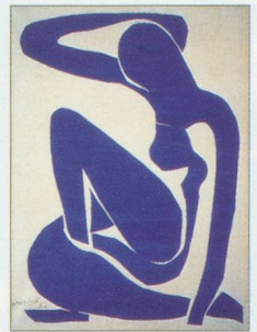
Henri Matisse « Nu bleu 1 » (1952) Fondation Beyeler.

► Fondation Beyeler 4125 Riehen-Basel, Suisse. Tél. : 0041 61 645 97 00.