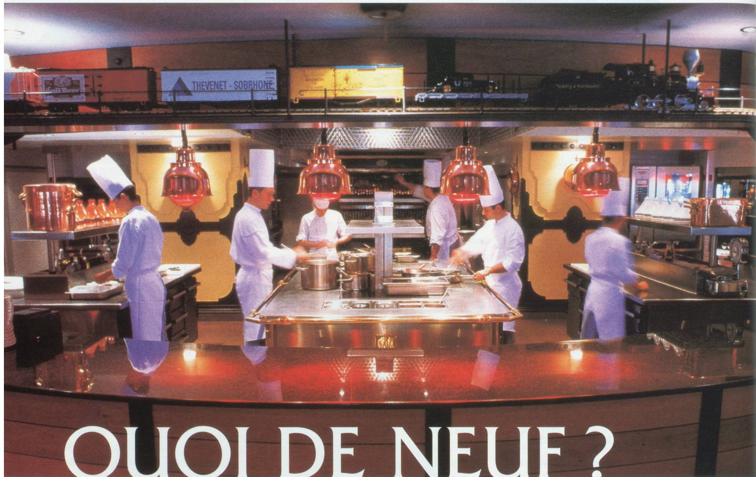
Les pianos de "L'Est", gare des Brotteaux à Lyon