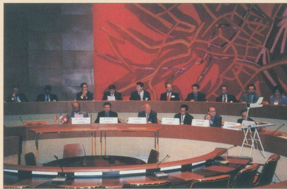
Les participants à la table-ronde, côté tribunes.

Au fil de leurs interventions, certaines réticences ont été plus particulièrement mises en évidence : les dernières mesures fiscales prises par le Gouvernement français et, surtout, la mise en place des 35 heures, sont vécues comme