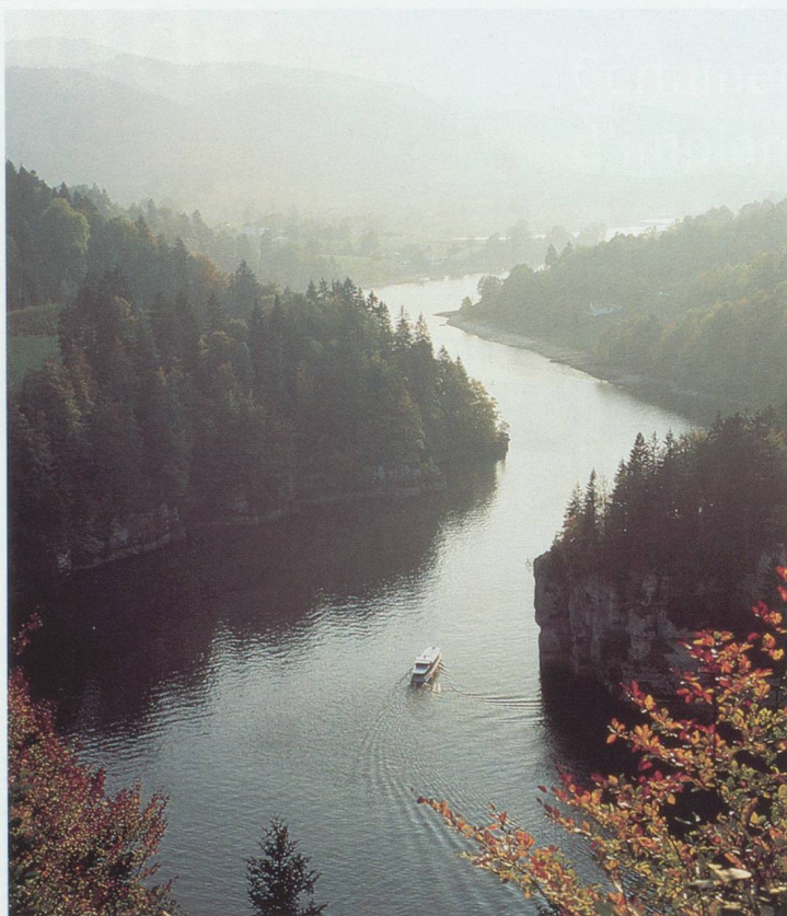
Le Doubs près des Brenets (Jura neuchâtelois).