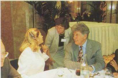
Un débat qui se poursuit bien après.