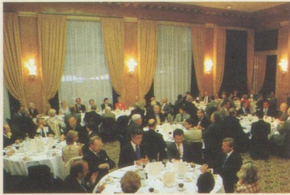
Un dîner animé. Vue générale de la salle.