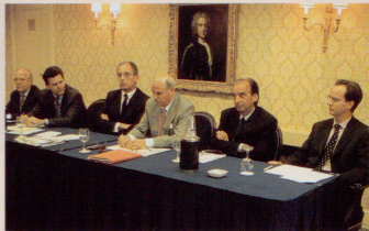
Assemblée générale de la CCSF. Présentation de l'exercice 1997.