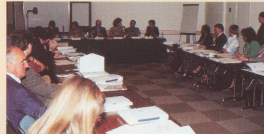
Une assistance attentive...