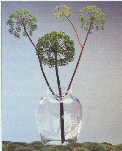
Baccarat : Vase aux feuilles - Collection « Les botaniques » créée par Christian Tortu.