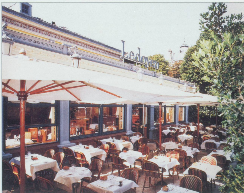
La terrasse du Cercle Ledoyen