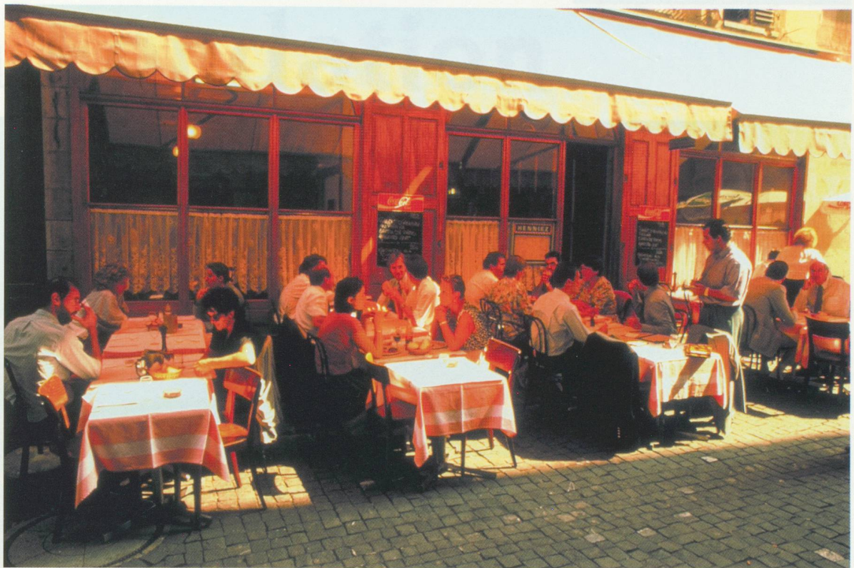
Restaurant vieille ville