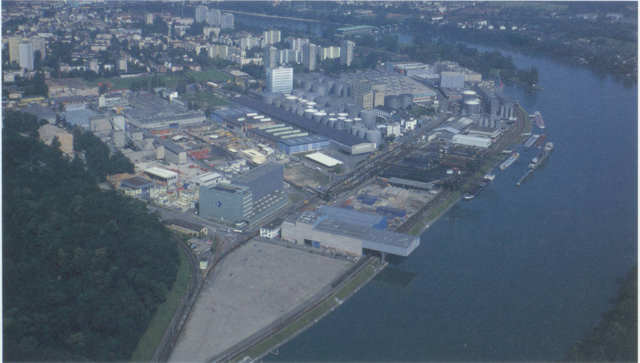
Hafen Birsfelden

permettent le transbordement et le stockage de produits secs classiques tels que l'acier, l'aluminium, les métaux non ferreux, mais aussi les carburants et les combustibles liquides. St Johann situé sur la rive gauche est le plus ancien. Il est notamment spécialisé dans le transbordement et le stockage de céréales et de produits secs en général ainsi que de l'huile alimentaire. Birsfelden