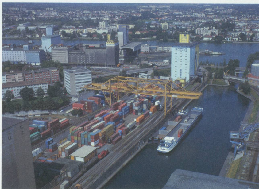
Rheinhafen Kleinhüningen

L'espace du Rhin supérieur, zone frontalière franco-germano-suisse, est l'une des régions les plus prospères et les plus peuplées d'Europe. Plaque tournante du transport de marchandises, la région de Bâle offre à la Suisse avec ses quatre ports rhénans une ouverture sur une façade maritime et un véritable carrefour pour les transports sur eau, sur rail et sur route.