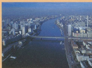
Visite Novartis