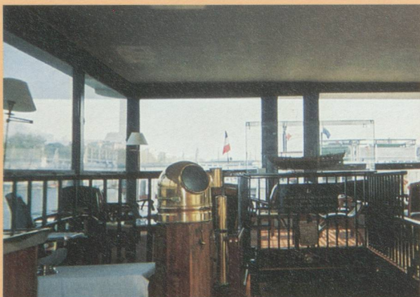
Péniche du Cercle de la Mer

présenté devant les adhérents de la CCSF, la spécificité de cette Suisse allemande difficile à appréhender de l'extérieur. Scindée en quatre parties : " Une " Suisse allemande ? " (une confédération de régions à fortes identités) ; " Le travail " (le triomphe de l'éthique protestante - La notion de compromis) ; " Le contact, le travail et l'après travail ", cette rencontre a eu un tel succès qu'elle sera reprise par la Région Rhône-Alpes Auvergne de la CCSF en mars 2003. Rappelons également les autres