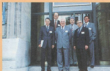
2 ème forum économique Rhodanien

L'Assemblée Générale de la CCSF Marseille-Sud-Est Méditerranée du 28 novembre 2002 a été suivie d'un dîner-conférence dont l'hôte d'honneur et conférencier était le Général de division Henri Lasserre, notamment ancien Gouverneur militaire de Marseille et Officier Général de la Zone de défense sud. Ainsi le thème de la soirée était-il " L'Armée de Terre en 2002 : un défi sur l'avenir ". L'Armée de Terre, qui a vu ses effectifs baisser de 40%, s'est professionnalisée et diversifiée afin de répondre à l'évolution du contexte stratégique international. Cette conférence a été suivie d'un dîner où plus de 80 personnes étaient présentes. Le 27 septembre 2002 avait lieu le 2 ème Forum Economique Rhodanien sur le thème de la logistique. Cette manifestation, initiée par l'association du Forum Economique Rhodanien (Sion-Suisse), a été organisée cette année par la CCI Marseille-Provence, en partenariat avec Provence Logistique et la Chambre de Commerce Suisse en France.