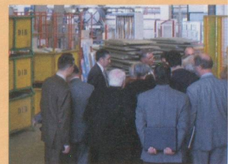
Ets Mobalpa