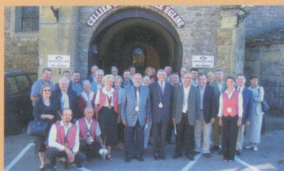
Cellier de la Vieille Eglise

La Chambre de Commerce Suisse en France, Région Rhône-Alpes Auvergne, a souhaité, dans le cadre de son développement, créer à Annecy une "Délégation Pays de Savoie" pour répondre aux attentes des chefs d'entreprises savoyardes qui bien naturellement entretiennent des relations fortes avec la Suisse Romande voisine comme dans la publicité, l'horlogerie, le transport, le décolletage ou le tourisme. Cette relation est également vraie pour