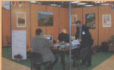
Salon Classe Export

des agents commerciaux français et suisses. Lors du Salon Classe Export au Palais des Congrès de Lyon, les 4 et 5 décembre 2002, la