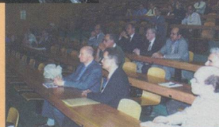
Conférence à l'Université de Haute-Alsace