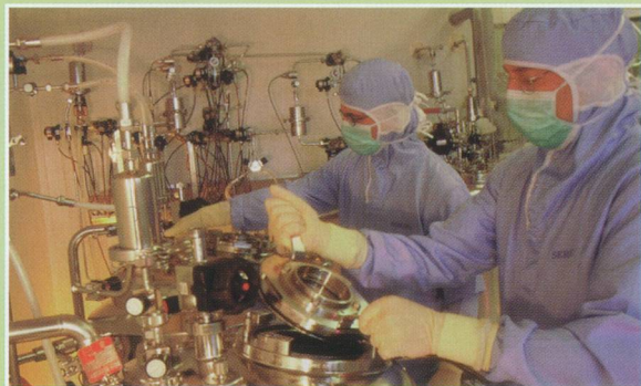
Serono un modèle de réussite technologique