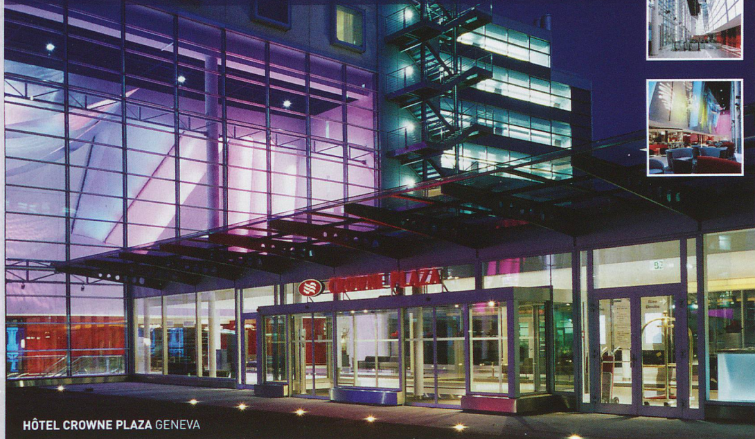
HÔTEL CROWNE PLAZA GENEVA