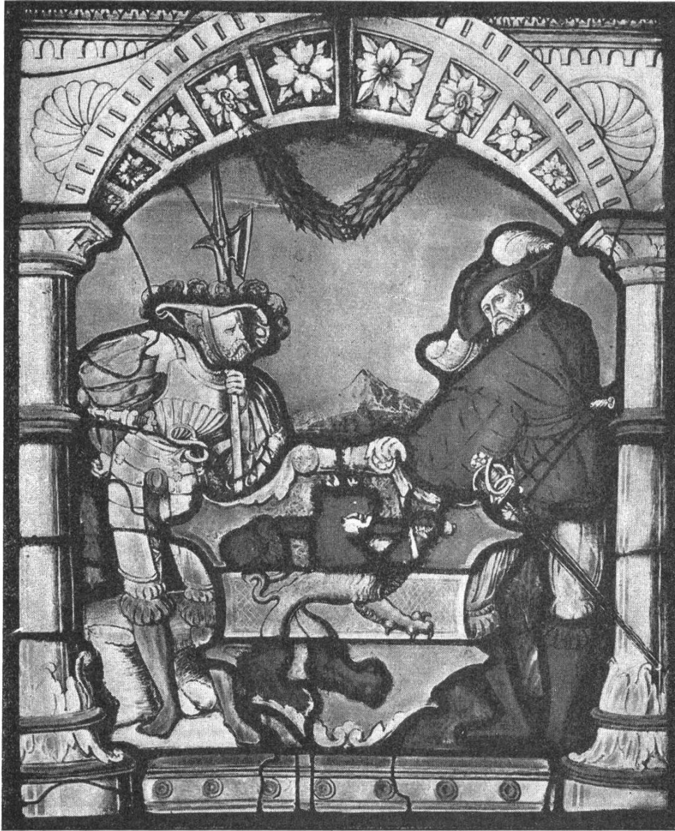
Wappenscheibe der Stadt Waldshut

pens" der obersten Waldstadt. Merkwürdigerweise bezeichnet noch F. Berster in seinem Berichte über Restaurierung der Wappenscheiben im Rathausaale zu Rhein-