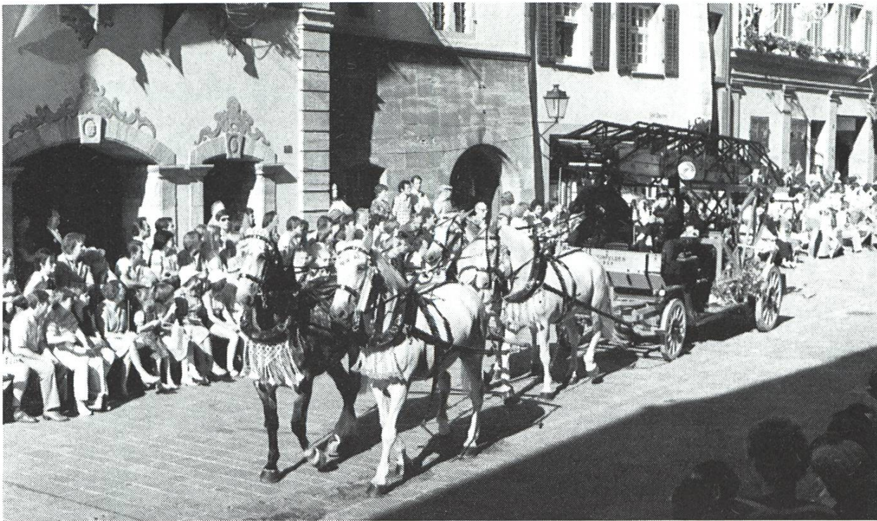
Mechanische Drehleiter Margirus 1929 mit Vierergespann während des Feuerwehrumzuges anlässlich der 850-Jahrfeier von Rheinfelden.

1945 wurden die Kriegsfeuerwehren aufgehoben. 1947 mussten auf Geheiss des Versicherungsamtes Stammkontrollen angelegt und das Wachtkorps wieder organisiert werden. Das geschah 1948, man rüstete es mit Messinghelmen und Absperrleinen aus. 1951 mussten auf Weisung des Versicherungsamtes die Kriegsfeuerwehren wieder gebildet werden. Übungen waren vorläufig keine abzuhalten, hingegen war das Kader in Kursen auszubilden.