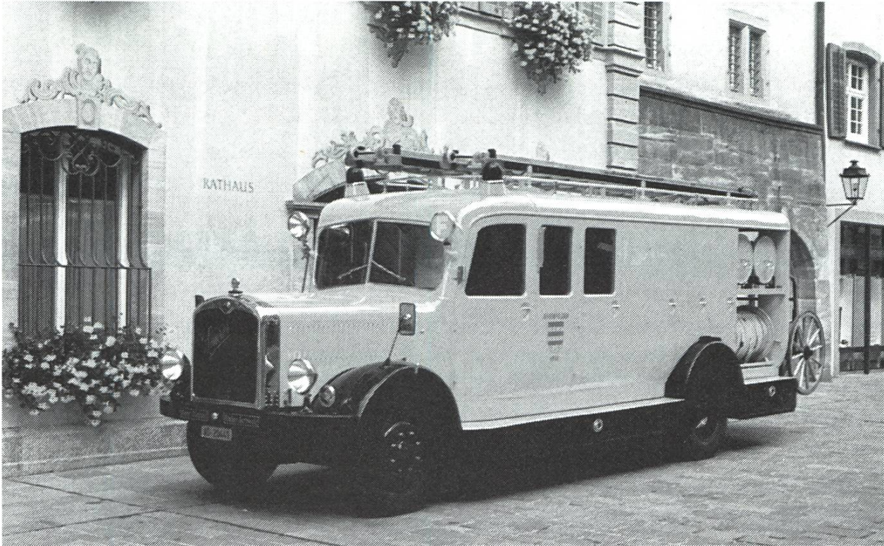
Erstes Feuerlöschfahrzeug der Marke Saurer (T.L.F.), 1938, mit 240 l Tankinhalt, Saug- und Druckpumpe.

Diskussion der Anschaffung einer Autospritze mit 327:311 knapp zu. Nach einer Besprechung mit dem Versicherungsamt zog man Offerten ein, liess sich von den Feuerwehren Aarburg, Biel und Pruntrut Autospritzen vorführen und gab, nach eingehenden Besprechungen mit dem Versicherungsamt, den Zuschlag den Gebrüdern Diebold in Baden, die mit Fr. 40 000.– am höchsten offeriert hatten. Im November wurde der Liefervertrag aufgesetzt und nach verschiedenen Änderungen am 31. Dezember dem Gemeinderat zur Unterzeichnung vorgelegt. Im April 1937 genehmigte ihn auch das Aargauische Versicherungsamt. Vom 10. bis 13. November hielt sich der Chefchauffeur der Feuerwehr zur «Entgegennahme der Fabrikinstruktionen und Kontrolle der Arbeiten» in der Firma Diebold in Baden auf, am 26. November fand dort im Beisein der Feuerwehrkommission die Rohbauabnahme statt. «Die erzielten Resultate waren durchweg sehr günstig», steht im Protokoll. — Zur gleichen Zeit etwa fand die alte Motorspritze noch einen Abnehmer, die Gebrüder Grell erwarben sie für Fr. 350.–. — Was die Autospritze anbelangt, so brauchte es noch viele Gespräche, mussten Dutzende von Briefen gewechselt werden — die Akten über das Feuerwehrauto füllen einen dicken Ordner —, bis sie am 10. Juni 1938 in Rheinfeldern eintraf. In der «Volksstimme aus dem Fricktal» vom 11. Juni 1938 konnte man tags darauf lesen: