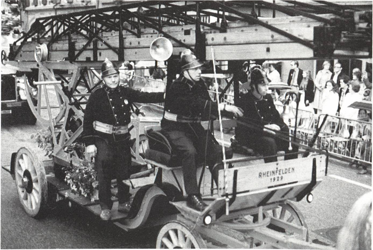
Mechanische Drebleiter Margirus 1929.

nem Grossbrand mit Rettungsdienst kann sich ein verringerter Mannschaftsbestand katastrophal auswirken. Die Feuerwehrkommission ist sich dieser Tatsache bewusst und wäre nicht bereit, die Verantwortung zu tragen.»