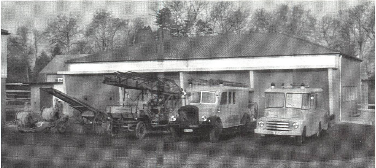
Einstellraum des in den 60er Jahren gebauten Feuerwehrmagazins an der Lindenstrasse. Das Opel Pikett-Fahrzeug rechts wurde im April 1960 angeschafft, die übrigen Fahrzeuge und Geräte in den Jahren 1928–1957.

bedürfnisse für das Feuerwehrmagazin abzuklären. Die Kommission lehnte aber ein Magazin ausserhalb der Altstadt ab, trat für getrennte Magazine ein und erachtete als besten Standort für ihr Magazin immer noch die Kapuzinerkapelle. Der Gemeinderat liess sich aber von seinen Plänen nicht abbringen. Am 3. September 1957 fand die entscheidende Sitzung von Gemeinderat, Bauverwaltung, Feuerwehrkommission und dem Direktor-Stellvertreter des Versicherungsamtes über das neue Feuerwehrmagazin statt. Es sollte wie das Bauamtsmagazin an die Lindenstrasse zu stehen kommen und eine Doppelgarage sowie Einstellräume für die übrigen Feuerwehrgeräte enthalten.