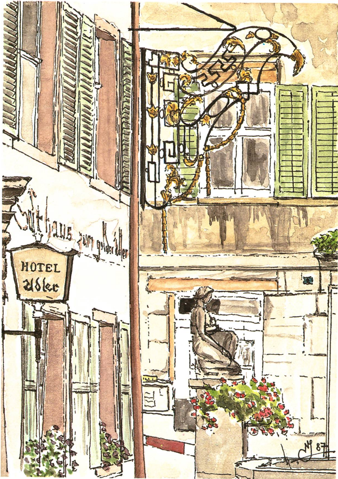
Auf dem Obertorplatz