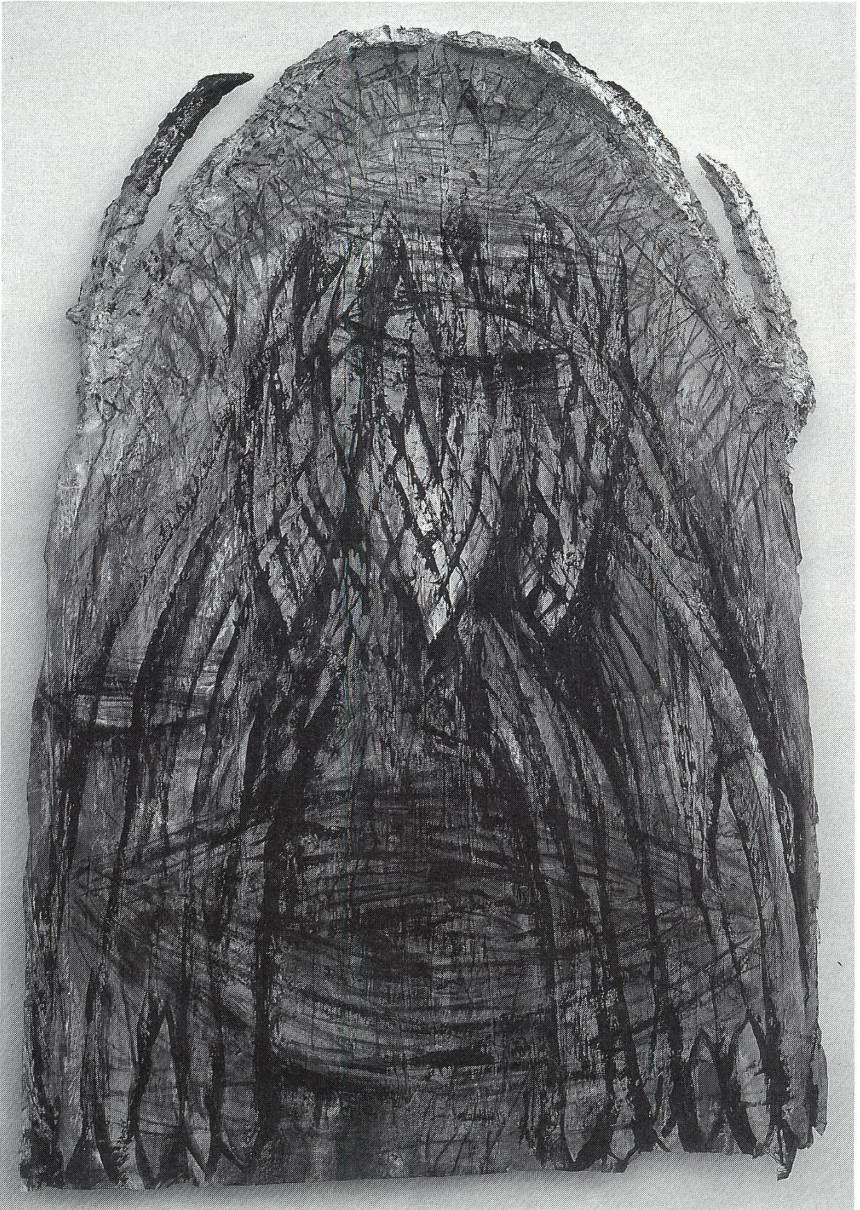
“Figuration” von Fritz Schaub, 1989, Mischtechnik auf Papier, Höhe 143 cm