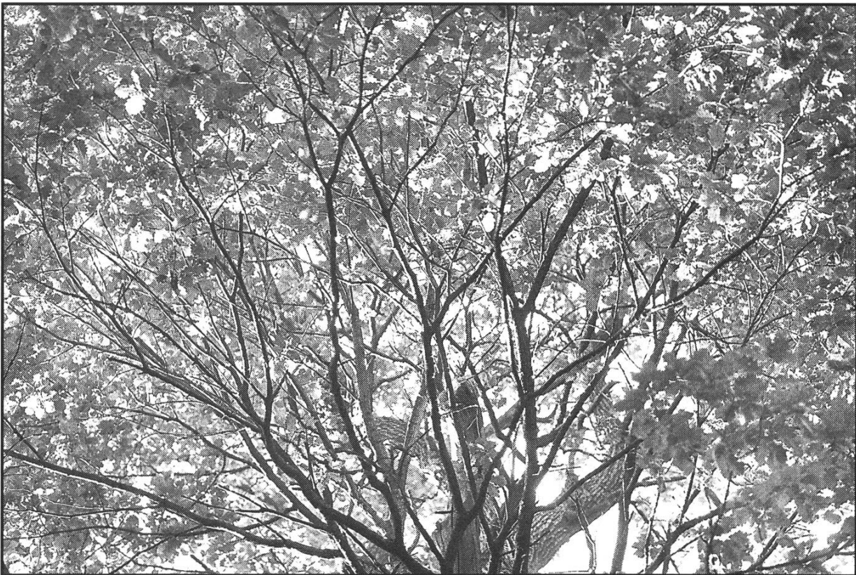
Bundeseiche von 1891

Julius Pokorny, Indogermanisches etymologisches Wörterbuch , Bern und München 1959 und 1969 / Friedrich Kluge u. Walter Mitzka, Etymologisches Wörterbuch der deutschen Sprache , 20. Aufl., Berlin 1967 / Handwörterbuch des deutschen Aberglaubens , Berlin und Leipzig 1927-1941. Heinrich Marzell, Die Pflanzen im deutschen Volksleben , Jena 1925 / Jacques Brosse, Mythologie der Bäume , Olten und Freiburg i. Br. 1990 / Bäume , Völkerkundemuseum der Universität Zürich, 1990 / Lexikon der Alten Welt , Zürich und Stuttgart 1965 / Jan de Vries, Kelten und Germanen , Bern und München 1960 / Andres Furger-Gunti, Die Helvetier, Kulturgeschichte eines Keltenvolkes , Zürich, 4. Aufl. 1991 / Michael Vescoli, Keltischer Baumkreis , 4. Aufl., Zürich 1990 / Johannes Hoops, Reallexikon der germanischen Altertumskunde , Strassburg 1911-1919 / Lexikon des Mittelalters , München und Zürich 1977 ff. / Albert Hauser, Das Neue kommt, Schweizer Alltag im 19. Jahrhundert , Zürich 1989.