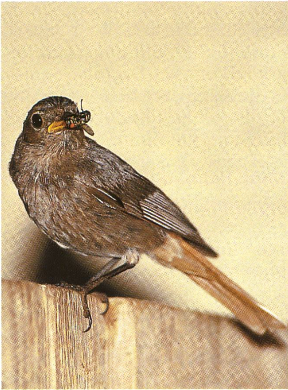
Weibchen des Hausrotschwanzes