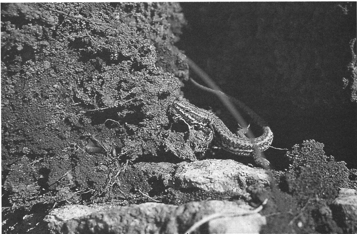
Die wärmeliebende Mauereidechse lebt an sonnigen, steinigen Standorten