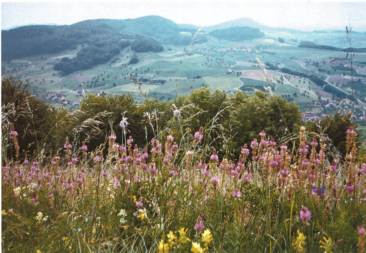
Farbenprächtig zeigen sich die Magerwiesen im Frühling (Laubberg)