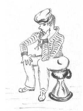
Vignette von G.O. Hausmann zum Gedicht «Rüste, mein Schiff, so rüste!», 1951.

C.P. 3 = offizielle Bezeichnung für: Compagnie de passage, Caserne Prud'homme, Gebäude 3.