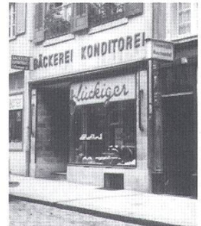
Das Domizil der Bäckerei Flückiger an der Marktgasse 35 während rund 55 Jahren.