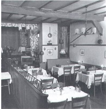
Der hintere Bereich des Speisereaurants, welches ab 1960 in Betrieb genommen wird.

Mit den Cigarren für meinen Grossvater in der Tasche bin ich nun bei meinem Einkaufsbummel zum erstenmal etwas durstig, und so entschliesse ich mich für eine kurze Pause und suche mir im