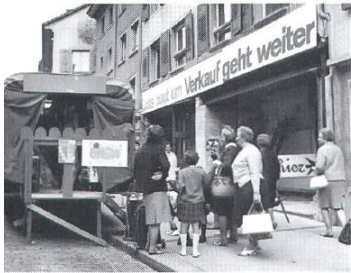
Trotz Umbau geht der Verkauf auf originelle Art weiter.