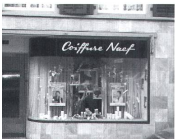
Das Coiffeur-Geschäft von Erwin Naef nach dem Umbau 1975 an der Marktgasse 6.