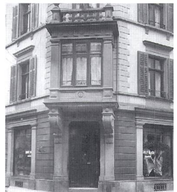
Die Metzgerei Bauer Anfang 1960.