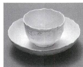
Koppchen und Unterschale, altes Trinkgeschirr zum Genuss von Kaffee.

Die Schokolade generierte wegen ihrer Zubereitung das aufwendigste Porzellan. Da Schokolade sehr heiss und schaumig getrunken wurde, waren neben den speziellen Tassen auch spezielle Kannen nötig. Sie hatten mehrheitlich einen seitlichen Henkel und Füsschen, um sie auf eine Warmhalteflamme stellen zu können, im Deckel befand sich oftmals ein mit einem Schieber verschliessbares Loch für den Quirl.