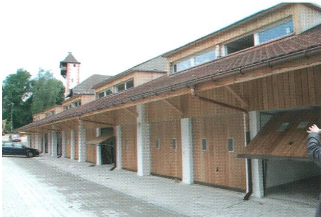
Moderne Garagen ersetzen die alten Scheunen.

Namen «Malteser» in der ausgedehnten Festungsanlage von La Valetta. Diese enthielt neben einem grossen Spital auch eine internationale Universität mit medizinischer Fakultät. Eine schlagkräftige Flotte sicherte das Mittelmeer gegen Türken und Piraten und kämpfte erfolgreich auch in der entscheidenden Seeschlacht von Lepanto. – In der französischen Revolution fiel die Insel an die Truppen Napoleons. Dies bedeutete das Ende des 700 jährigen souveränen Ordens. Auch die 19 Kommenden im Territorium der Eidgenossenschaft wurden aufgelöst. Der Orden organisierte sich im 19. Jahrhundert neu als katholischer Malteserorden mit Sitz in Rom. Dieser wirkt bis heute international caritativ und humanitär, insbesondere in