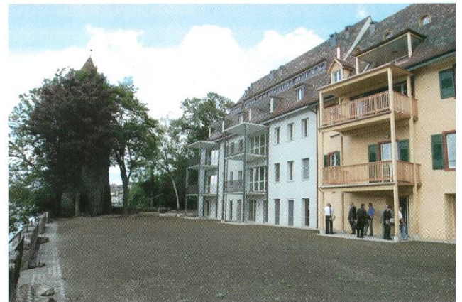
Die Rheinseite wurde modernisiert.