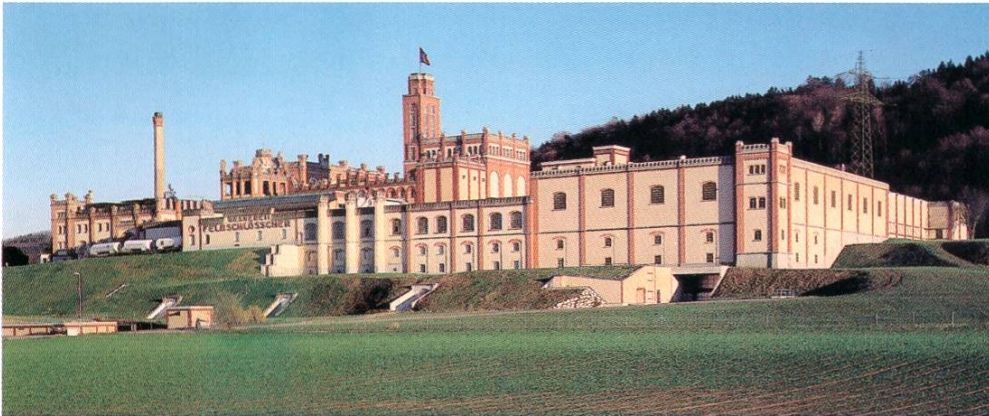
Gesamtansicht der heutigen Schlossanlage mit Palas und Bergfried.

Diese Aspekte beleuchten Entwicklungen, die zur