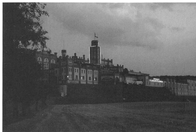
Nachtsansicht vor 2007.

Vor dem Aufkommen von Kältemaschinen war der Unterschied zwischen obergärig und untergärig entschei-