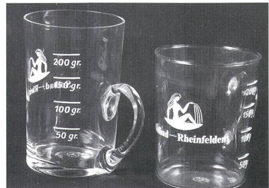
Becherglas vom Kurbrunnen mit Henkel, Masseinteilung: 50/100/150/200 g, gedruckte Inschrift «Kurbrunnen Rheinfelden». 1960er-Jahre FM E. 870. Becherglas vom Kurbrunnen mit Henkel, Masseinteilung: 50/100/150/200 g, gedruckte Inschrift «Kurbrunnen Rheinfelden». Nympe in Halbschale mit Quellandeutung als Signet. Hersteller Simax Tschechoslowakei. 1960er/ 1970er-Jahre

Ein weiteres Lebenswerk waren die Wiederentde-