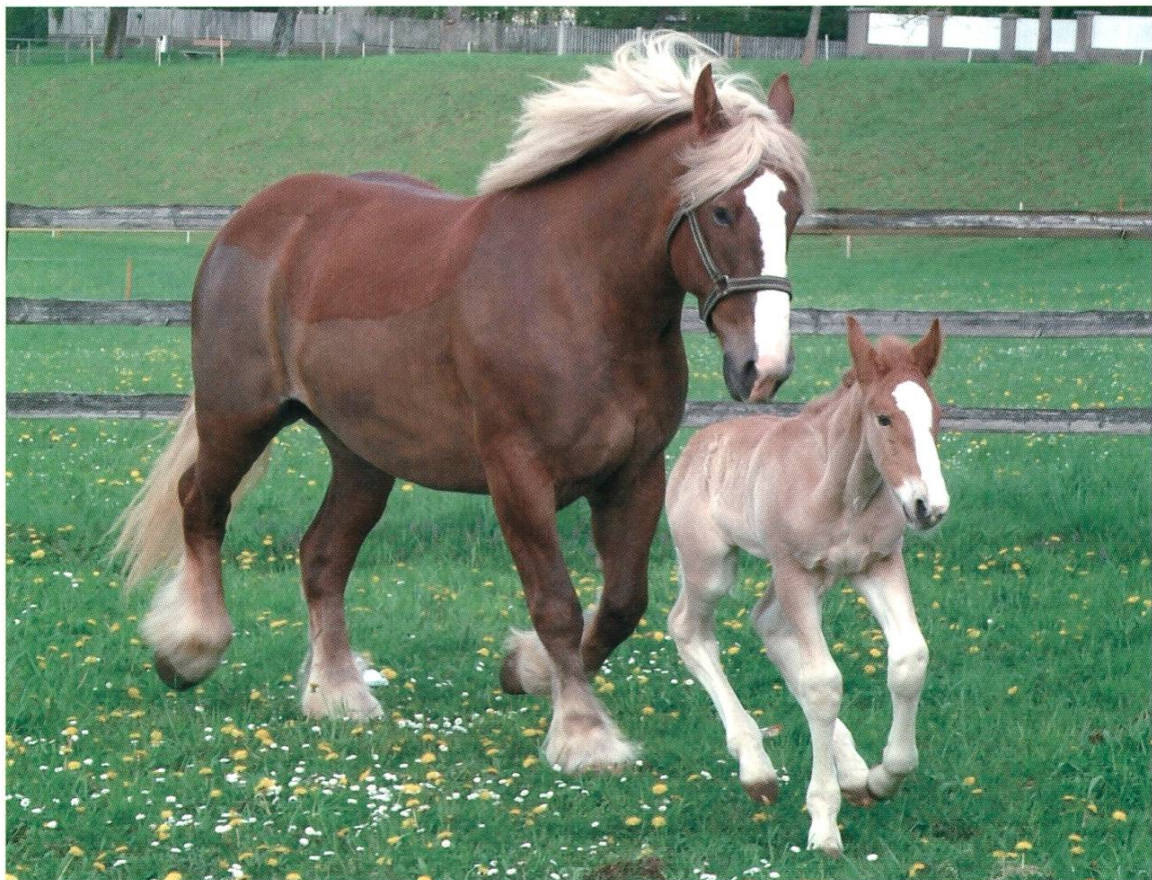
Aramis - der jüngste Spross der Brauereipferde mit seiner Mutter Pouliche.