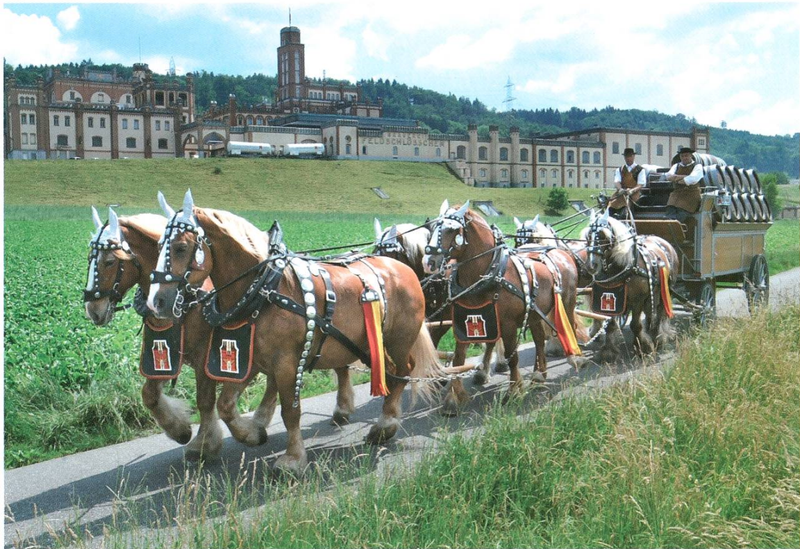
Ein Sechsspänner – hochbeladen und festlich geschmückt.