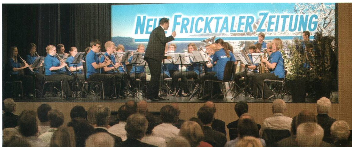
Die Jugendband Wegenstettertal eröffnete die Jubiläumsfeier im Kurbrunnensaal mit einer fulminanten musikalischen Einlage.

fassbar, die im fernen Bundeshaus gemacht wird. Und das ist staatspolitisch erwünscht, denn hier spüren die Menschen wenn die Krankenkassenprämien steigen, der Zug überfüllt ist oder Arbeitsplätze wegbrechen. Lokalzeitungen dienen als Informations- und Werbeplattform und damit als unerlässlicher Wirtschaftsfaktor für lokale und regionale Anbieter. Unter diesen Voraussetzungen, dank einer neugierigen Redaktion und einem innovativen Verleger, der auch vor neuen Plattformen wie iPhone App oder dem «Localpoint» nicht zurückschreckt, wird der Neuen Fricktaler Zeitung auch weiterhin eine prosperierende und erfolgreiche Zukunft beschieden sein. Herzliche Gratulation zum 150. Geburtstag.»