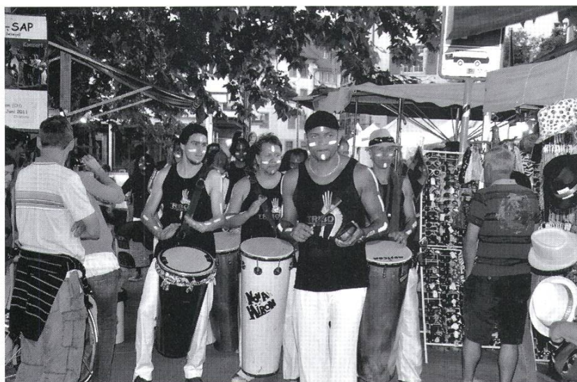
Bringt Freude und Atmosphäre ins Städtli, das Festival der Kulturen.