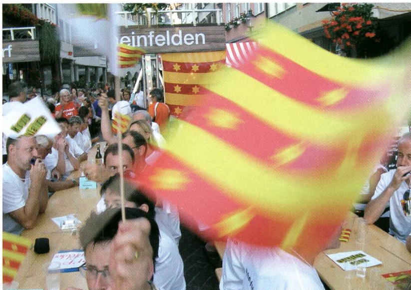
Rheinfelden zu Gast in Schweizer Fernsehstuben: «Donnschtig-Jass» aus dem Städtli.