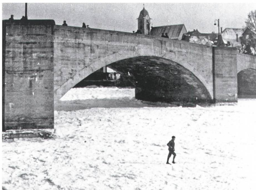
Die «Rhygfröri» von 1929

übereinander, bis sich wieder genügend Eis angesammelt hatte, um das Wasser zu stauen. Bei der Wanzenau, unterhalb des heutigen Strandbades in Rheinfelden, türmten sich die Eismassen regelrecht auf. In der Nähe der Brücke erreichte die kompakte Eisschicht stellenweise eine Dicke von drei bis vier Metern. Weiter flussaufwärts verstopften Eisschollen den Kanal und die Rechenanlage des damaligen Kraftwerks Rheinfelden. Da die Turbinen wegen des mangelnden Wassers nicht mehr arbeiteten, musste die Anlage den Betrieb fast vollständig einstellen, was zu beträchtlichen wirtschaftlichen Einbussen führte, da durch den Elektrizitätsmangel evoziert in zwei Fabriken Produktionsstillstände eintraten. Doch gereichte die «Rhygfröri» diesen auch zum wirtschaftlichen Nachteil, so verzeichneten die Gasthäuser von Rheinfelden und Augst Hochbetrieb. Denn seitens der Bevölkerung zog dieses Ereignis grosse Aufmerksamkeit auf sich. Die örtliche Zeitung berichtet am 19. Februar 1929, dass tausende Menschen einer «schwarzen Schlange» gleich von Rheinfelden in Richtung Augst spazierten. Auch Schlittschuhläufer nutzten begeistert die Gunst der Stunde und neben Fahrradfahrern sah man sogar Motorradfahrer auf dem Eis, während am Augster Stausee zur Unterhaltung der Besucher sogar Musik aufspielte.