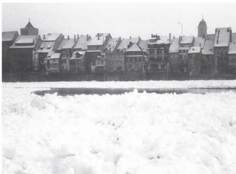
Eisschollen vor der Silhouette der Altstadt

des heutigen Kraftwerks in Rheinfeldern und bis zum Stausee in Augst doch eine partielle Eisschicht zu bilden. Vergleicht man nun die beiden Geschichten und die Form ihrer Dokumentation so ist interessant, dass aus der Zeit der ersten «Rhygefröri» zahlreiches Bildmaterial existiert, obgleich damals Photographieren nicht jedermann möglich war. Der Anlass schien aber so besonders für die Menschen zu sein, dass Porträts mit dem dramatischen Umfeld bei den Photographen bestellt wurden. Während in den 60er Jahren das Photographieren viel populärer war, als das Naturereignis oder Motiv aber nicht mehr die gleiche Sensation erregte, was sich in einer sehr geringen Anzahl von Aufnahmen spiegelt.