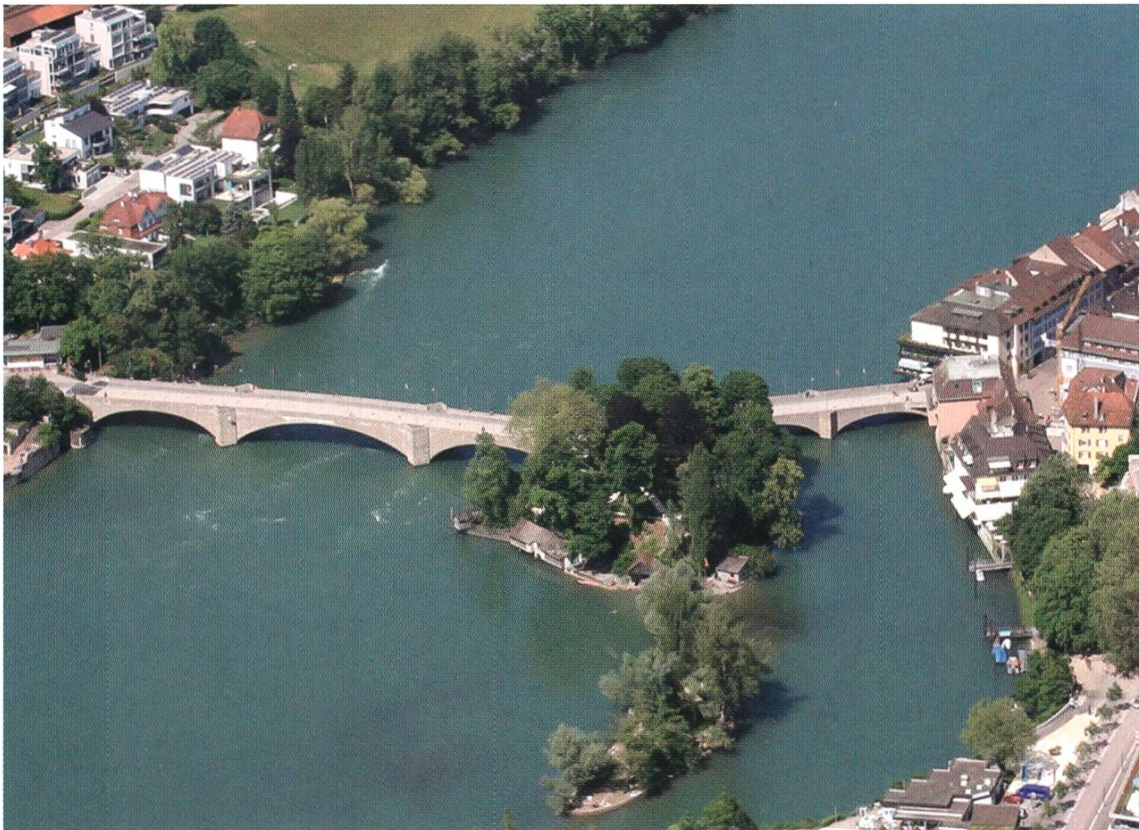
Die Brücke zwischen heute und morgen

Mit der Schliessung der Brücke für den Autoverkehr im Jahr 2008 sind die langen Autoschlangen zur Rushhour oder bei anderen hohen Verkehrsaufkommen Geschichte geworden. Spazieren auf der Brücke, Flanieren nahezu ohne Autos ist heute möglich, und das Feste feiern mit allen Rheinfeldern, jenseits und diesseits des Rheines ist sehr beliebt und hat sich schon mehrfach bewährt. Aber auch die ruhigen Stunden des Verweilens im Park, der Dank seiner Restaurierung ganz neues Erleben möglich macht, sind gegenwärtig. In die Zukunft gerichtet sind die Träume manch eines Rheinfelders und manch einer Rheinfelderin von einer gepflegten Buvette am Parkrand, die das Erleben der blauen Stunde am Rhein auch in gediegenem Rahmen mit einer kleiner Erfrischung ermöglichen würde. Doch das sind Geschichten, die vielleicht einmal in der Zukunft geschrieben werden können, schliesslich sind heute die guten alten Zeiten, an die wir uns in 10 oder 20 Jahren zurück erinnern werden, dann ist Heute Geschichte und wer weiss, welche neuen, alten Geschichten wir dann an der Brücke, auf der Brücke und über die Brücke erzählen können.