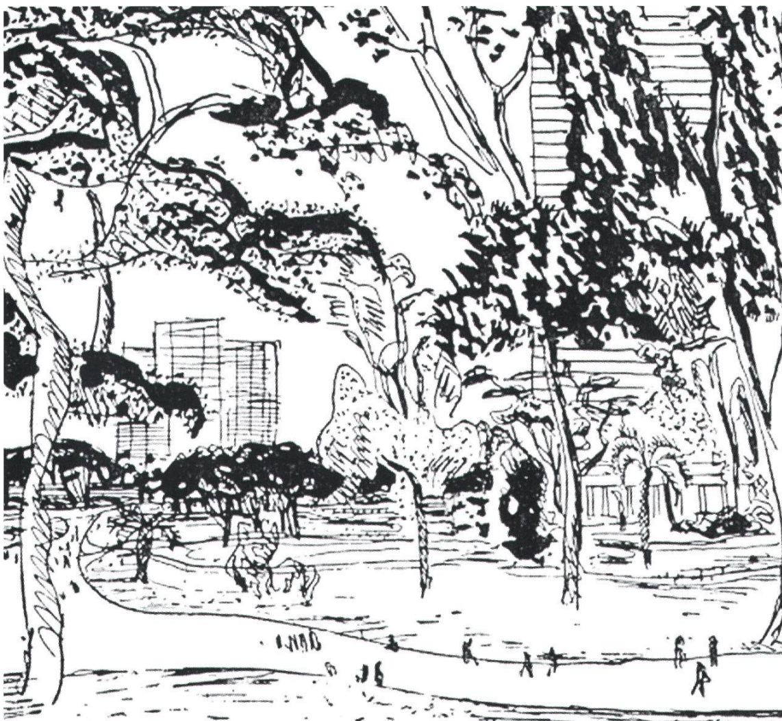
Skizze Le Corbusiers zur Ville Radieuse

Verglichen mit der weiter oben erwähnten Gropiusstadt und ihren heute noch rund 38'000 Bewohnern sind dies kleine Siedlungen. Wesentliche Grundprinzipien der Charta von Athen sind aber gleichermaßen erkennbar: relativ lockere Bebauung mit grossen Freiräumen, hohe Appartementhäuser, Durchmischung von Gebäuden unterschiedlicher Höhe, und neben den Bereichen der Wohnnutzung ein