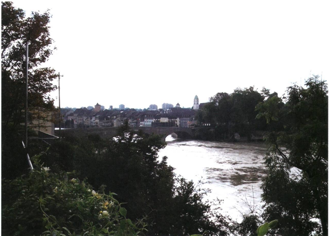
Die Silhouette Rheinfeldens

Es sind Kirchtürme, Silos oder Hochhäuser, die aus der umgebenden Bebauung herausragen. Je nach Standort und Blickwinkel, und entsprechend mehr oder weniger prominent treten die Hochhäuser