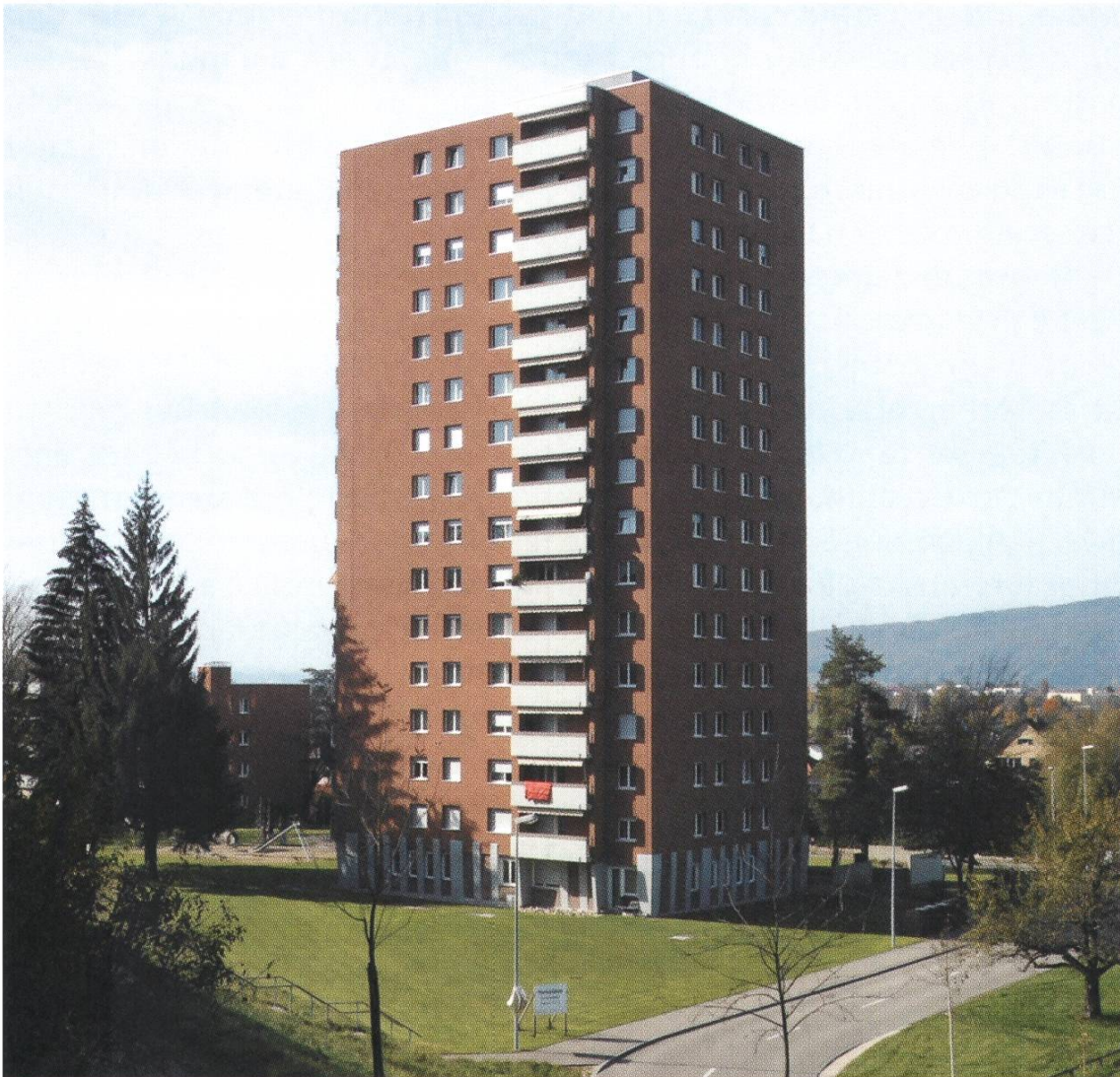
Hochhaus am Rütteliweg

werden und stehen leer. Im optimalen Fall können sie zumindest anderweitig genutzt werden. Aber der damit einhergehende Verlust von Treffpunkten, gewissermassen gemeinschaftlichen Identifikationspunkten führte in der Vergangenheit bei manchen derartigen Siedlungen zu einer Abwärtsspirale hin zur unbelebten und unpersönlichen Schlafstadt. Hohe Fluktuationsraten und in einem nächsten Schritt hohe Leerstandsquoten evozierten eine veränderte soziale Zusammensetzung der Quartierbevölkerung sowie rückläufige Mieteinnahmen. Dies wiederum setzte mit entsprechendem Unterhaltsrückstand die Abwärtsspirale weiter fort und führte im schlimmsten Fall zu sozialer und baulicher Verwahrlosung ganzer Siedlungen.