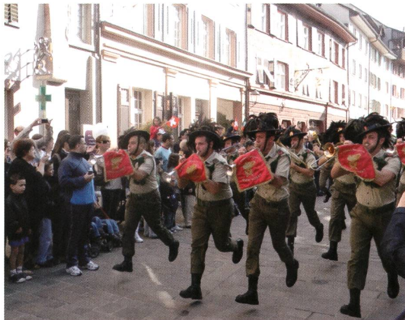
Bersaglieri am Umzug zum Anlass der Italia 150.