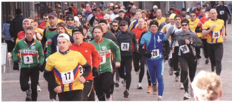
Der Fricktaler-Cup als Rheinfelder Stadtlauf