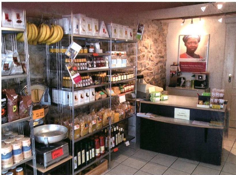
Ein breites Angebot dank ehrenamtlicher Tätigkeit.

Die claro fair trade AG handelt in diesem Sinne mit qualitativ hochstehenden Spezialitäten aus nachhaltiger Produktion hauptsächlich aus dem Weltsüden. Die Partner von claro sind in erster Linie Produzentinnen und Produzenten aus den Randregionen des Südens und Europas. Diese Partner produzieren auf sozial und ökologisch nachhaltige Weise qualitativ hochwertige Produkte. claro fair trade fördert mit ihrer Nachfrage die Artenvielfalt in einer kleinräumigen Landwirtschaft, unterstützt mit ihrer Tätigkeit soziale Projekte und fördert genossenschaftliches und gewerkschaftliches Denken bei den ProduzentInnen und deren MitarbeiterInnen. Für die Produkte ihrer Partner im Süden eröffnet claro fair trade Absatzkanäle in den Ländern des Nor-