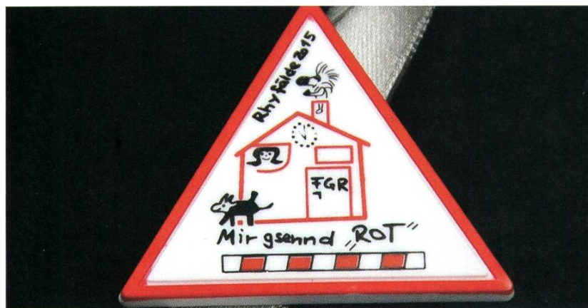
Die umstrittene Fasnachtsplakette

Vor 111 Jahren sind die beiden Flusskraftwerke Rheinfelden und Beznau zum Parallelbetrieb zusammengeschaltet wor-