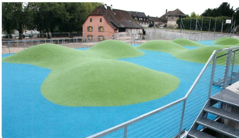
Spiellandschaft auf dem Parkhausdach