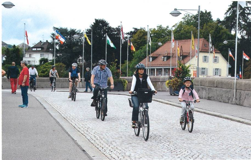
SlowUp, Basel Dreiland