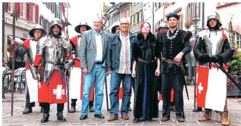
Herbstwarenmarkt am Mittelalter- spektakel

4. und 5. Oktober 2014: Zum zweiten Mal wird der traditionelle Rheinfelder Herbstwarenmarkt durch ein Mittelalterspektakel ergänzt und lockt Tausende von Besuchern in die Altstadt. Mit dem Mittelaltermarkt lebt die Geschichte der alten Zähringerstadt wieder auf. Die Ortsbürgergemeinde unterstützt die Veranstaltung mit rund 30'000 Franken.