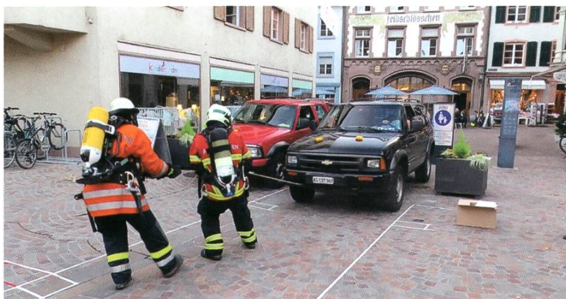
Wettkampf der Atemschutz-Trupps