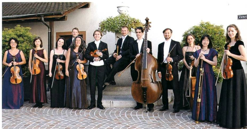
Das Rheinfelder Barock-Orchester Capriccio

22. bis 24. August 2014: Strassenkünstler, Musiker und Akkrobaten kommen nach Rheinfelden. Zum achten Mal wird das Festival «Brückensensationen» durchgeführt.