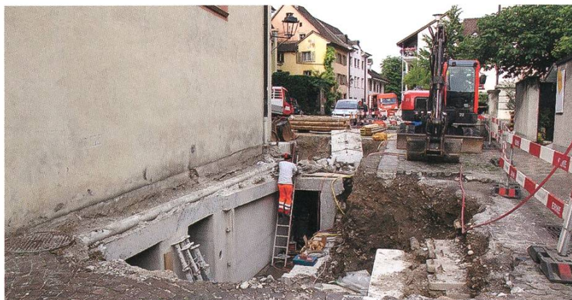
Der Bunker unter der Kapuzinerkirche