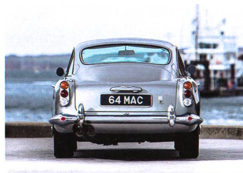
Paul McCartney's Aston Martin mit dem Kennzeichen «64 MAC», der in Rheinfelden Station machte.