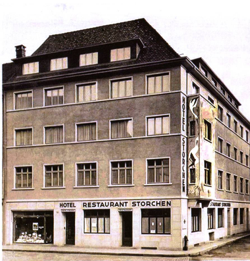
Hotel Solbad Storchen Rheinfelden

Paul erinnert sich an seinen Aufenthalt in Klosters: «Ich kann mich besser daran erinnern, wie wir «Revolver» geschrieben haben, als an die Aufnahme. Ich war in der Schweiz und machte zum ersten Mal Skiurlaub. Ich war bei «Help» ein bisschen Ski gelaufen und hatte Spass daran, deshalb bin ich in die Berge und am Ende hockte ich in einem Schweizer Chalet in einem kleinen Bad und schrieb «For No One».» (Paul McCartney, The Beatles Anthology).