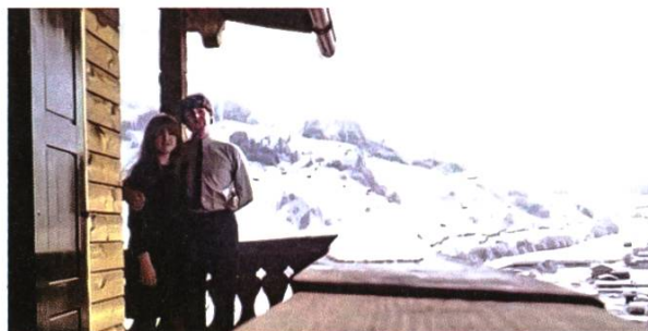
Paul McCartney und seine Verlobte Jane Asher in Klosters, März 1966: auf dem Skilift Madrisa und auf der Terrasse im Casa Rosmarie.