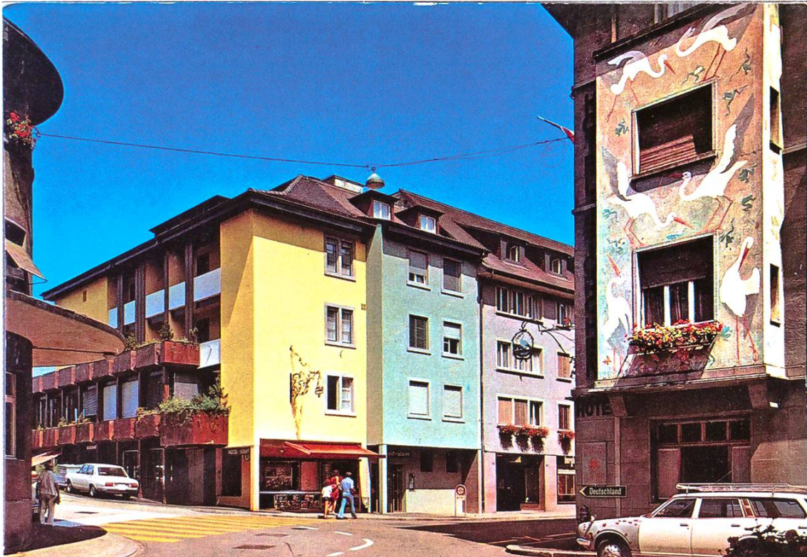
Das ehemalige Hotel Storchen in Rheinfelden von der Fröschweid aus gesehen.