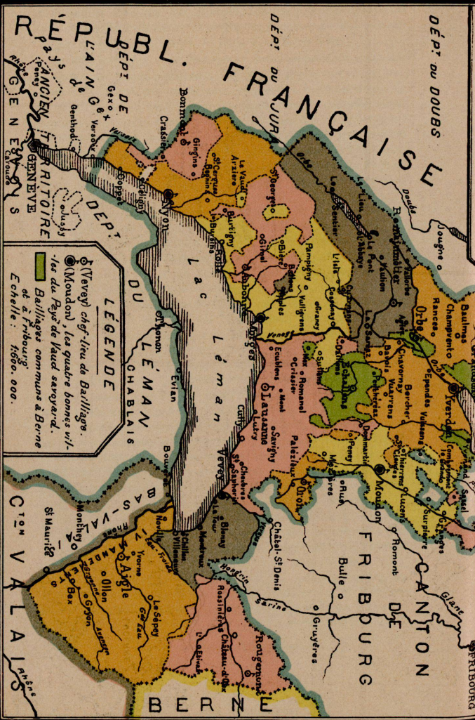
LES BAILLIAGES BERNOIS DU PAYS DE VAUD. (1798)