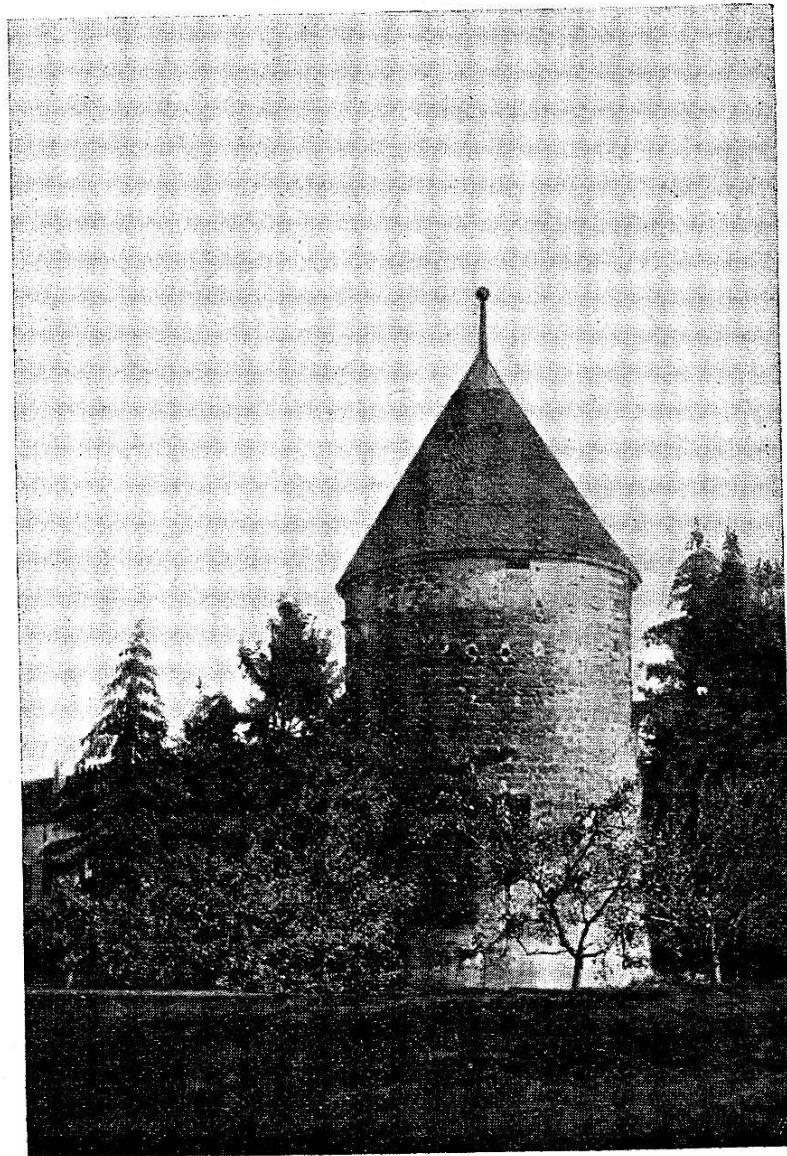
Donjon de Rolle.

les archères inférieures, très allongées, semblent indiquer une disposition fréquente dans le midi de la France, assez rare chez nous, et qui permettait un tir plongeant aussi bien qu'à la volée. Au sommet de la tour, vous noterez les créneaux murés, et, du côté du fossé, les restes des poutres d'un hourdage ou plutôt d'une bretèche ; les poutres ont été sciées mais leurs extrémités sont restées dans les rainures ménagées à cet effet.