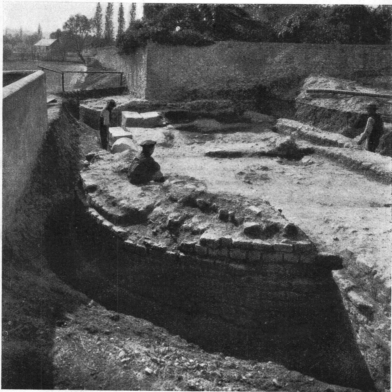
FIG. 10. — La porte de l'Est découverte en 1906, avec ses deux tours semi-circulaires.