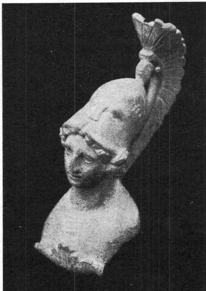
FIG. 12. — Tête de Minerve, en bronze, trouvée en 1906.

La seconde consiste en deux débris de plats portant comme ornements le Chrisme, c'est-à-dire le monogramme du Christ, accompagnés des deux lettres grecques Alpha et