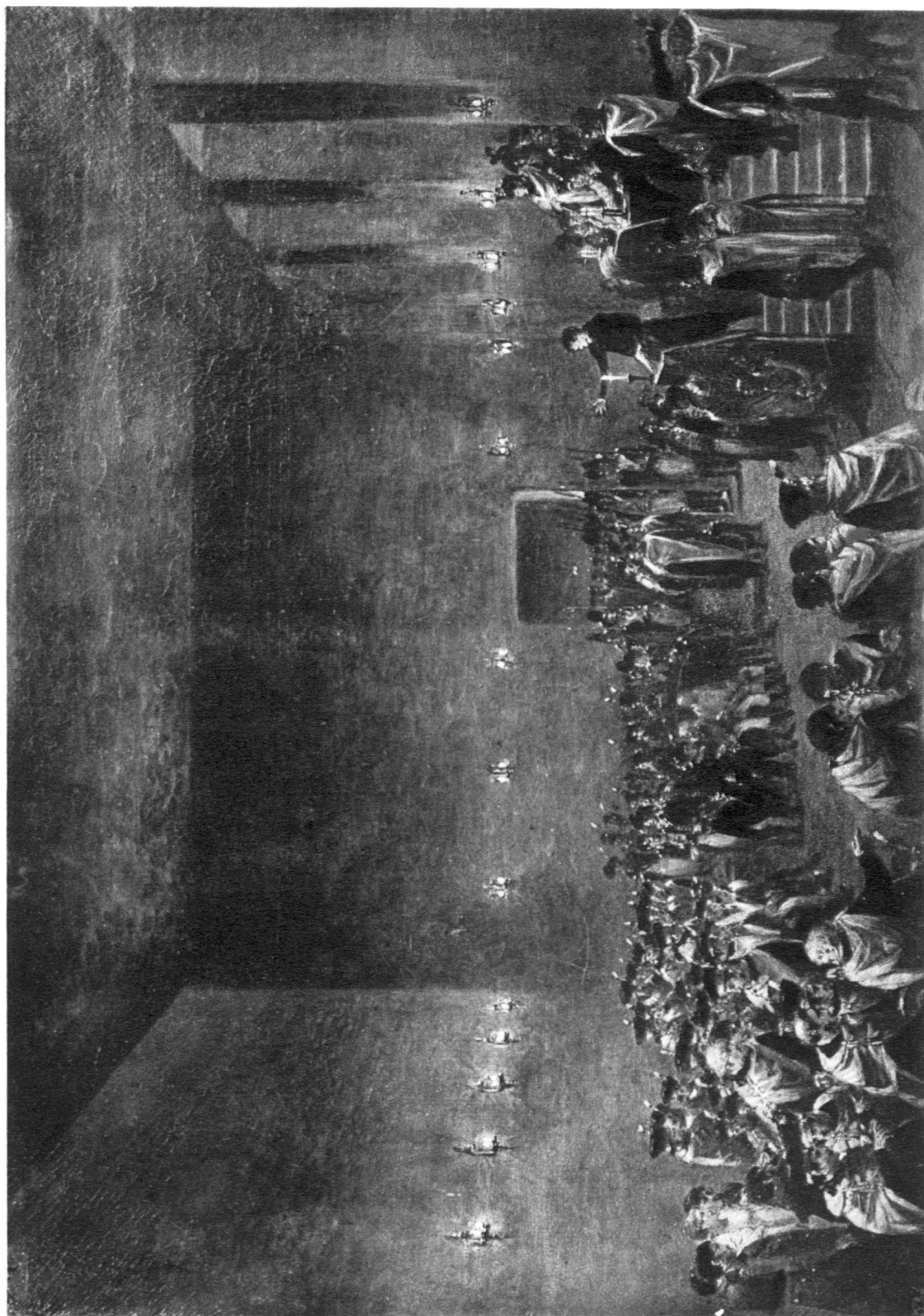
INTÉRIEUR DE LA SALLE DES CINQ-CENTS A ST. CLOUD