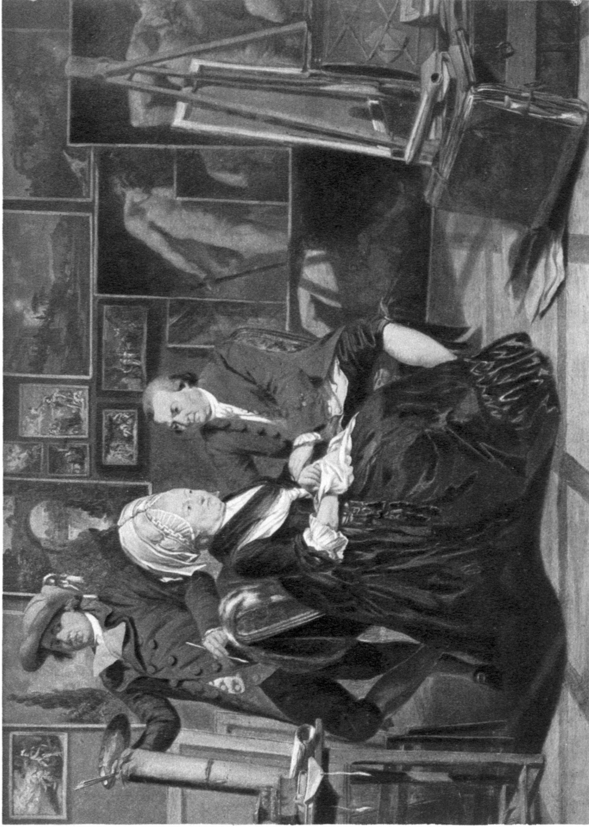
LE PEINTRE DANS SON ATELIER, 1781