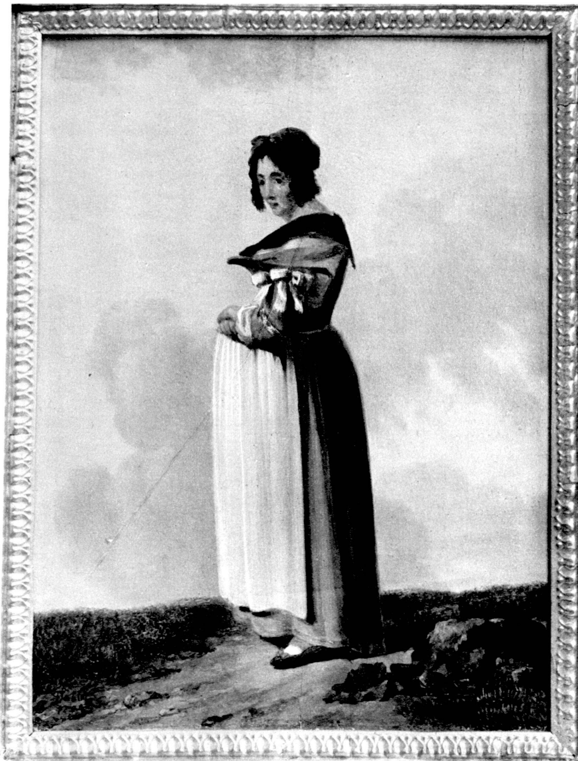
PAYSANNE A GENSANO, 1793