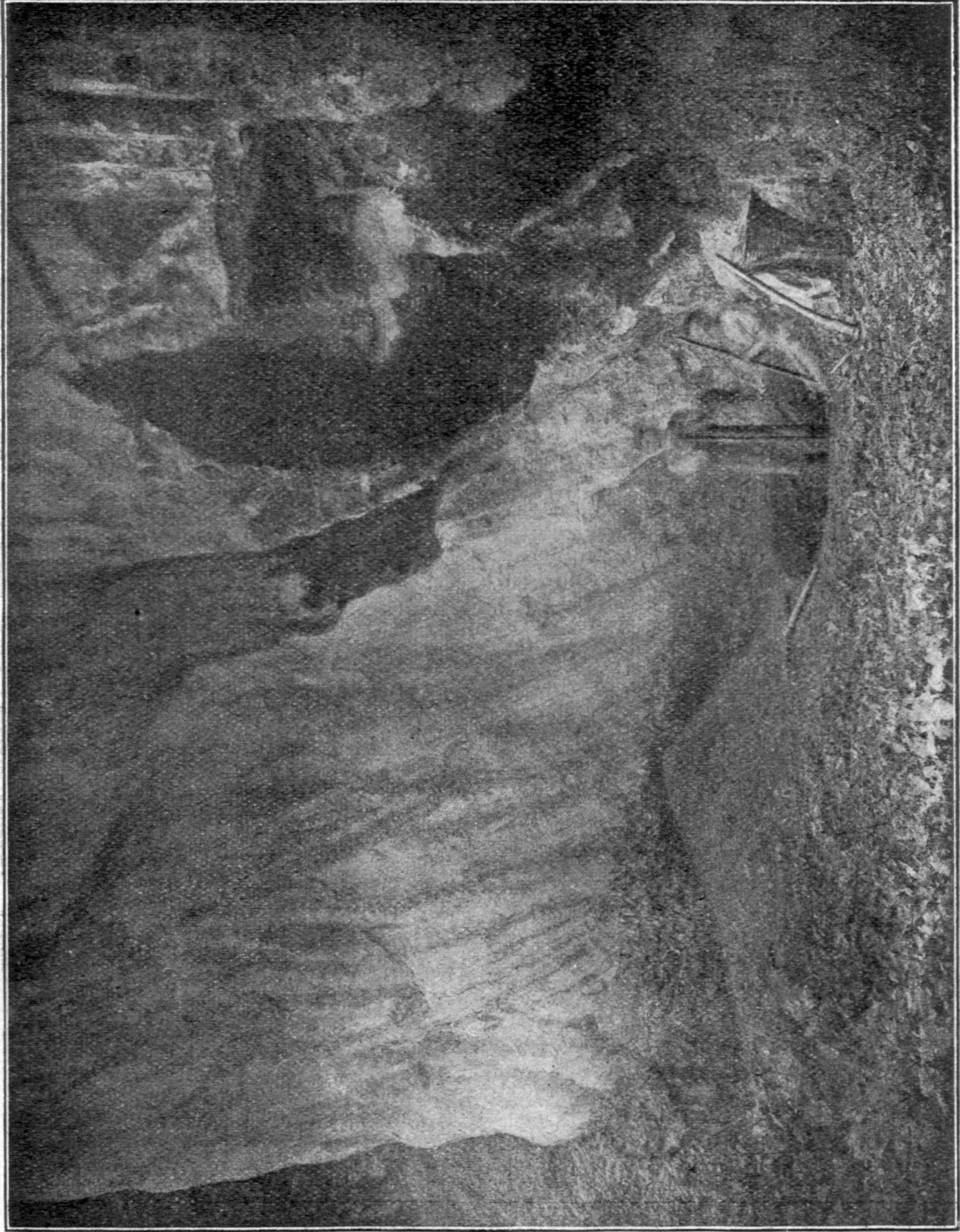
La station vue du côté plaine.