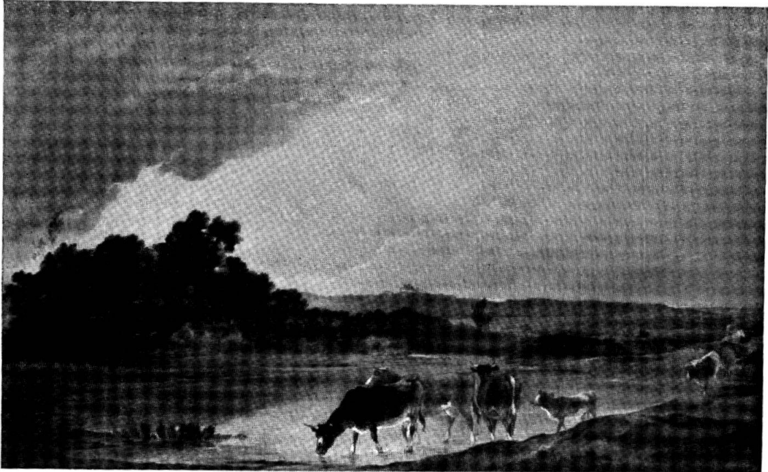
PAYSAGE AVEC TROUPEAU Galerie Dulwich, Londres.