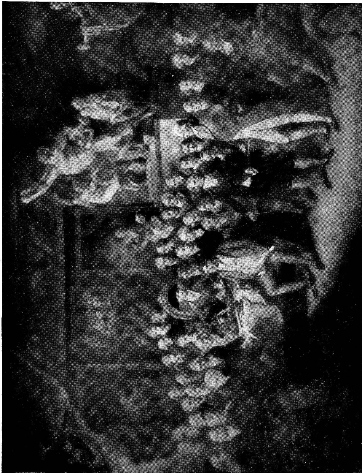
ASSEMBLÉE DE L'ACADÉMIE ROYALE EN 1802. Tableau de H. Singleton.

Propriété de l'Académie Royale, Londres.