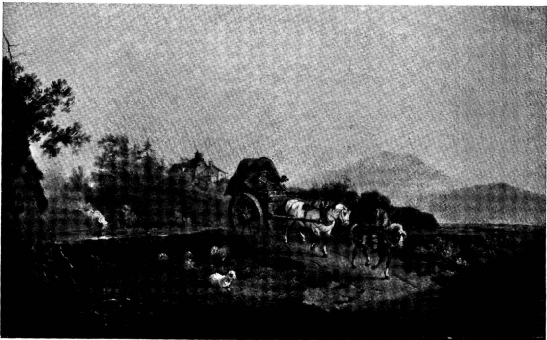
PAYSAGE ANGLAIS Château de Giez.