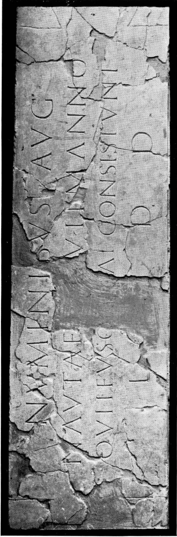
Dédicace des bateliers du lac Léman (n° 1).