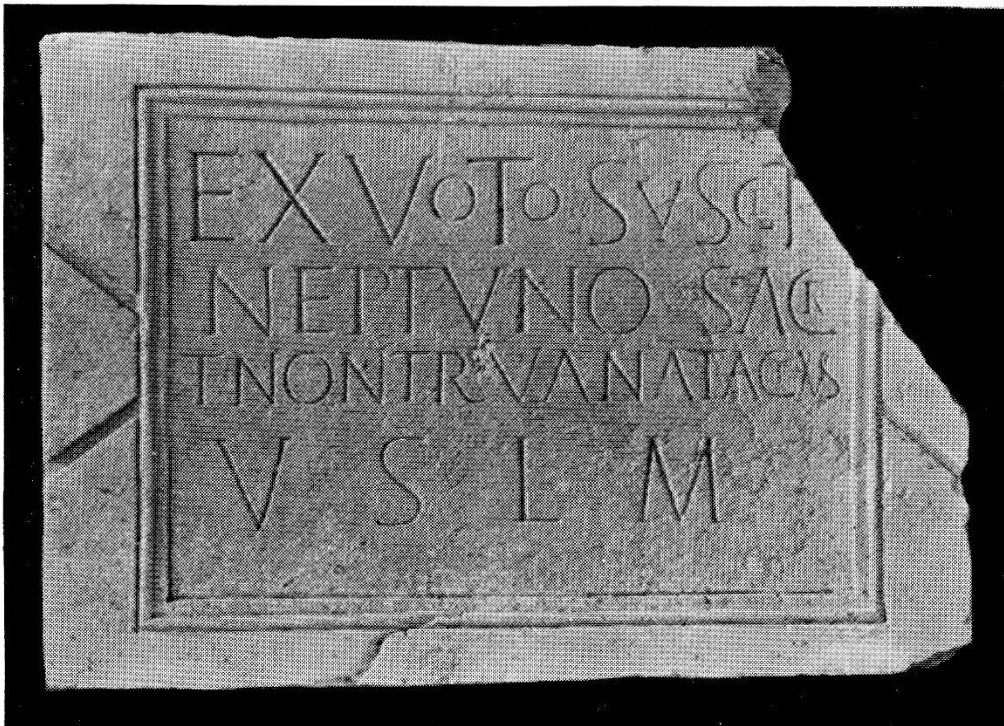
2. Dédicace à Neptune (n o 4).