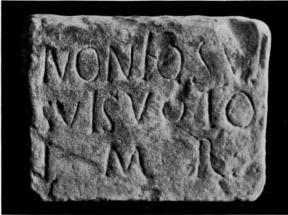
1. Dédicace aux Suleviae (n° 5).