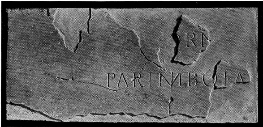
2. Fragments d'un placage de marbre (n° 10).