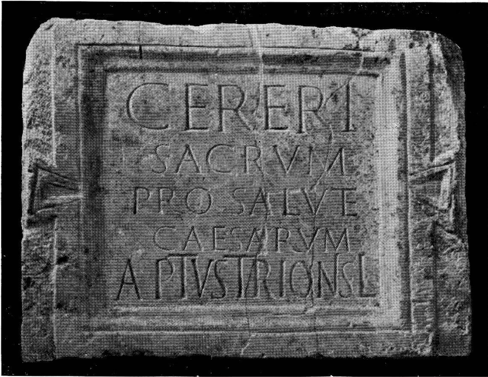
1. Dédicace à Cérés (n o 2).